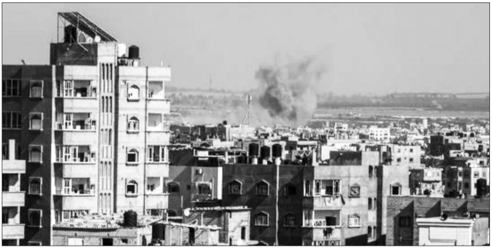
እሥራኤል በዓለም አቀፍ ሕጎች መሠረት መንቀሳቀስ አለባት ብለዋል። ከቅርብ ቀናት ወዲህ በጋዜ ትልቁ ሆስፒታል በሆነው አል-ቪፋ ዙሪያ ያለው አካባቢ ከባድ ውጊያ የሚካሄድበት የጦር ቀጣና ሆኗል። በሆስፒታሉ በሽሮች የሚቆጠሩ ሰዎች ተጠልለው

የአሜሪካው ፕሬዚዳንት ጆ ባይደን እንዳሉት አል-ቪፋ ሆስፒታል በዙሪያው ከሚደረጉ ከባድ ውጊያዎች መጠበቅ አለበት» ያሉ ሲሆን፤ የዩኤ ጠቅላይ ሚኒስትር በበኩላቸው