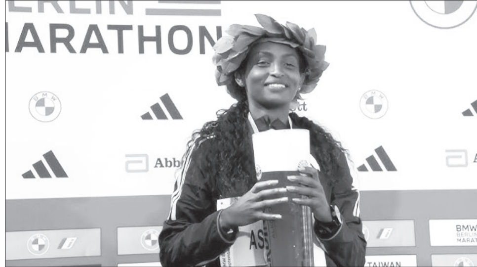
አትሌት ትዕግስት አሰፋ የዓመቱ ምርጥ አትሌቶች ስልጣትን የማሸነፍ አድልዎ አሳትፎ

ማራቶን በሴቶች የዓለም ክብረወሰን የሆነ ሰዓት ያስመዘገበችው ትዕግስት አሰፋ ከመጨረሻዎቹ አምስት አጩዎች አንዷ መሆኗን የዓለም አትሌቲክስ ከትናንት በስተቀር ይፋ አድርጓል። ትዕግስት ከሰበረችው የማይደፈር የማራቶን ክብረወሰን ባለፈ አስደናቂው ያለፈ ታሪኳ ትኩረት በመሰጠት በመላው ዓለም እጅግ አነጋጋሪ አድርጓታል። በመላው ዓለም ያሉ አትሌቶችን በተለይም ሴቶችን ልታበረታታ ልታነቃቃ የምትችል እንደመሆኗ በስፖርት ቤተሰቡ በተሰጣት ድምጽ ላይ የዓለም አትሌቲክስ ባለሙያዎች ይሁንታም ተጨምሮ በት ለዓመታት ከኢትዮጵያ የራቀውን ክብር እንደምታስመልስም ይጠበቃል።