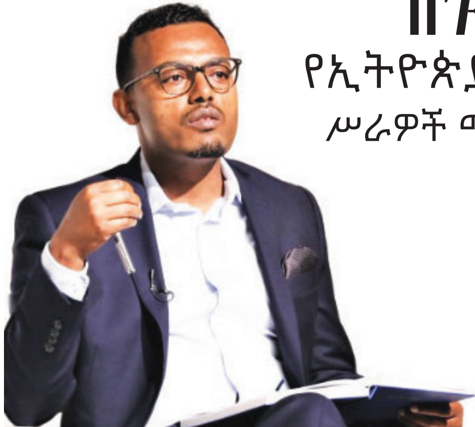
ስት ማሞ ምሕረቱ