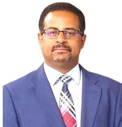
ስት ሰውስሰገድ በላይህ