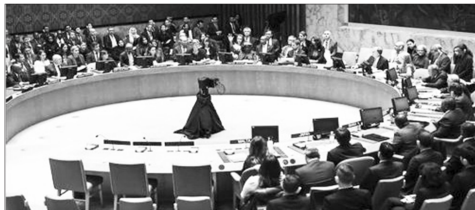
እና ፍልስጤም ያለውን ሁኔታ አስመልክቶ ባለፈው ሳምንት