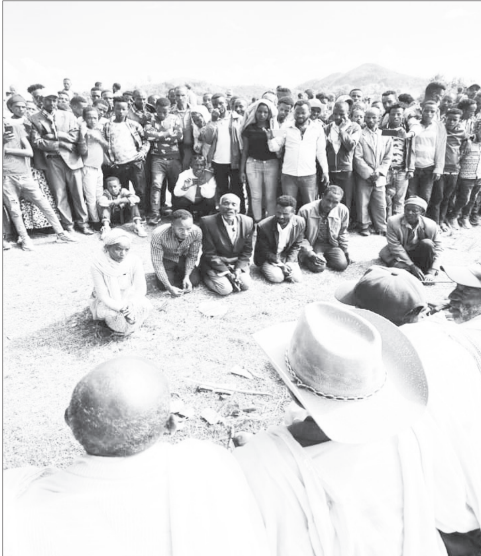
የየም ብሔረሰብ አባቶች በየዓመቱ ጥቅምት 17 «ቦር ተራራ» ላይ ለመድኃኒት ለቀማ ይሰማራሉ።

የሚቀምጡት ባህላዊ መድኃኒት ለልዩ ልዩ ሕክምና አገልግሎት ይውላል። ከአጽዋቱ ከ100 በላይ ለሚሆኑ የበሽታ ዓይነቶች ፊሞሽ እንደሆኑ የሚታመንባቸው ባህላዊ መድኃኒቶች ይቀመማሉ።