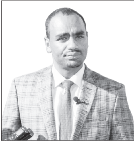
ሐሳብገጠው ተሾመ (ዶ/ር)