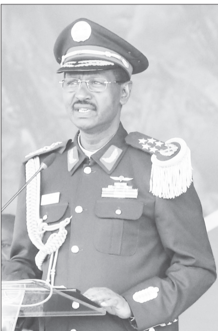
ፊልድ ማርሻል ብርሃኑ አፄ

የሠራዊቱ አመራሮችና አባላት ከቀደምት ጀግንነትን በክብር የተረከቡትን ሀገር አስጠብቀን ለመጨው ትውልድ ለማስተላለፍ ቃል እንገባለን ያሉት ፊልድ