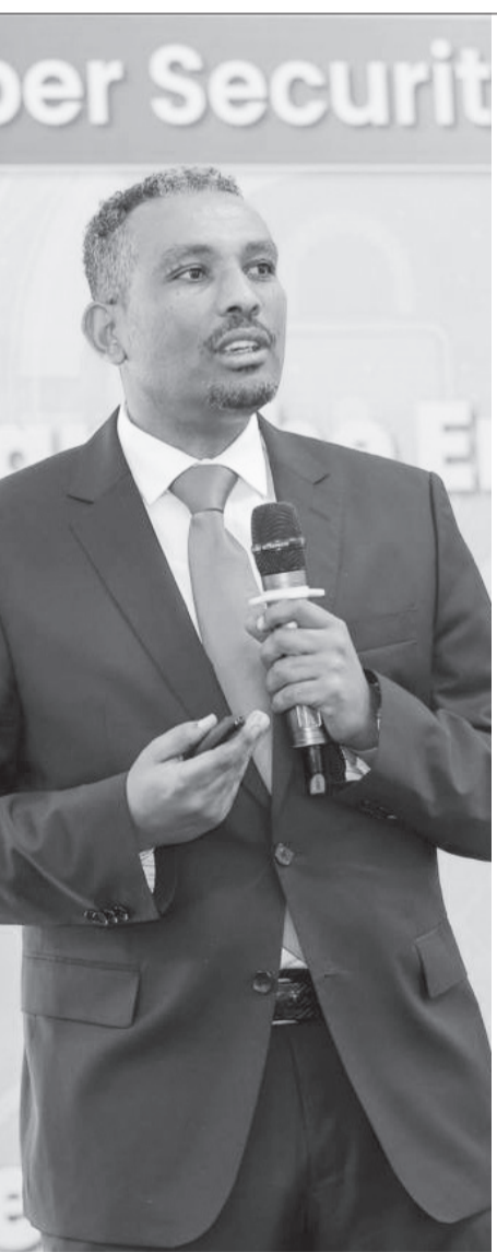
ሐጎ ፀጋዬ ማሞ

“የኢትዮ ቴሌኮም እና የባንክ ሠራተኞች ነን” ብለ ለመርዳት በማስመሰል በሚደውሉ ሰዎች እንዳይታሉሉና ምንም ዓይነት የገንዘብ ዝውውር እንዳያደርጉ አስጠንቅቀዋል።