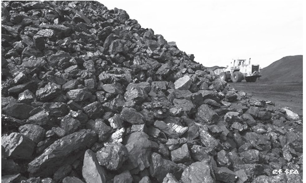
በ2015 በጀት ዓመት አንድ ነጥብ ሀብት ሚሊዮን ቶን የድንጋይ ከሰል ተመርቷል

ከአቅዱ አንጻር አፈጻጸሙ ውስን ነው የሚሉት ኃላፊው፣ ለዚህም በርካታ ችግሮች መኖራቸውን ነው በምክንያትነት የሚጠቅሱት። ከገቢም አንጻር 30 ሚሊዮን ብር ገቢ ለማስገባት ታቅዶ፣ 29 ነጥብ3