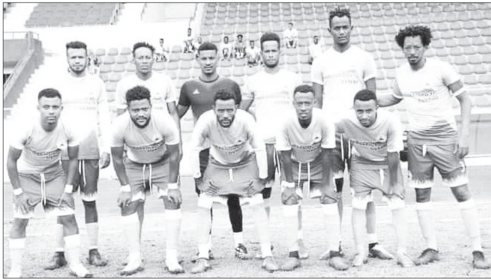
ሻሸመኔ ከተማ እና ሀምበራች ዳራሚ የመጀመሪያ የፕሪሚየር ሊግ ጨዋታቸውን ከጠንካራ ክለቦች ጋር ያደርጋሉ።

የ2016 የኢትዮጵያ ፕሪሚየር ሊግ አዲስን የውድድር ዓመት የመጀመሪያ ሳምንት ጨዋታዎች ባለፈው አሁን በሁለት ጨዋታዎች መጀመሩ ይታወቃል። በአዳግ ሳይንስና ቴክኖሎጂ ዩኒቨርሲቲ ጅምርውን ባደረገው የአንደኛ ሳምንት መርሃ ግብር አዳግ ከተማን ከአዲስ አዳጊው ኢትዮጵያ ንግድ ባንክ አገናኝቶ ያለምንም ግብ ሲጠናቀቅ፤ በቡና ደርቤ ኢትዮጵያ ቡና ለምንም በሆነ ውጤት ሲዳግ በናን ማሸነፍ ይታወቃል። የሊግ አንደኛ ሳምንት ቀሪ ጨዋታዎች ዛሬ ቀጥለው የሚካሄዱ ሲሆን፤ ወደ ሊግ ያደጉት ሁለት ክለቦች የሚያደርጉት ጨዋታ ይጠበቃል።