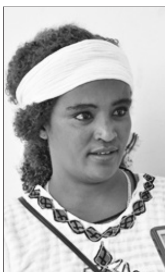
ወጣት ስሜነሽ ወብዓለም