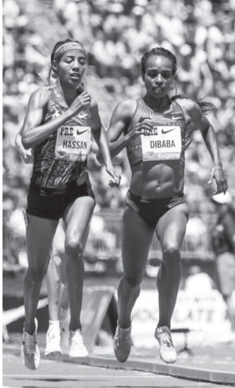
ሁለቱ የመካከለኛ ርቀት ኮከቦች በማራቶን የሚያደርጉት ፉክክር ትኩረት ስቧል።

እኒህ ከ2017 አንስቶ ከመካከለኛ ርቀት ውድድር ወደ ጎዳና ላይ ፉክክሮች የተሸጋገረው አትሌት ሰይፉ በሴኦል ማራቶን የመጀመሪያ ተሳትፎው ሁለተኛ ደረጃን ይዞ