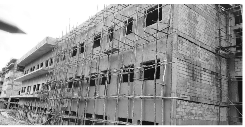
በሁኑ ወቅት አጠቃላይ የግንባታው አፈጻጸም 55 ነጥብ 24 በመቶ ላይ ይገኛል።

የሆስፒታሉ ግንባታ የአእምሮ ሕክምና፣ የአናቶች እና የሕፃናት ሕክምና፣ የካንሰር ሕክምና መስጫ እና ማዋለጃ፣ የድንገተኛ ክፍል፣ ላብራቶሪ ፣ ክሊኒክ-ሬይ/ X-ray/ የጨረር ሕክምና (Nuclear medicine)፣ የሥነ-ልቦና ሕክምና መስጫ፣ የቀድ ጥገና ሕክምና መስጫ፣ ማቀዝቀዣ ክፍል፣ ቤተመጻሕፍት፣ ካፍቴሪያ እና