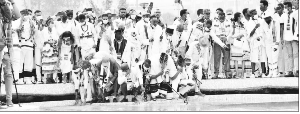
በሳምንቱ ውስጥ በዓሉ በተለያዩ መርሃግብሮች እንዲከበር መደረጉን ገልጸው፤ በበዓሉ የሚታደሙ ቱሪስቶችን ቁጥር እንዲጨምር የሚያስችል ሥራ መከናወኑን አስረድተዋል።