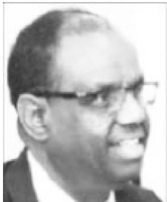
(በግብር/ግጥም/ግንባታ ስልጠና) gebroseni@gmail.com