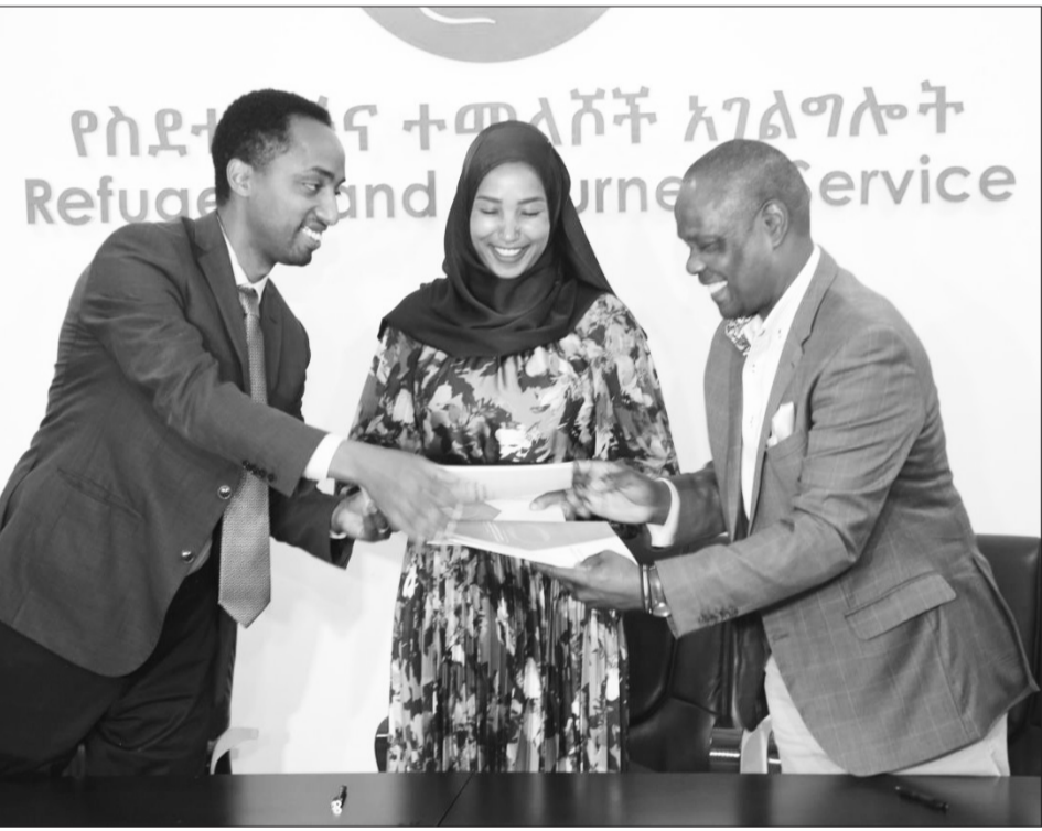
ስምምነቱ በሀገሪቱ የሚገኙ ስደተኞች የዲጂታል ብሔራዊ መታወቂያ እንዲኖራቸው የሚያስችል ነው። ስምምነቱን የተሰማሙት ተቋማት የጋራ የመረጃ