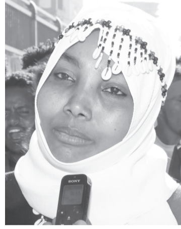
ወጣት ሰሚራ ተማም