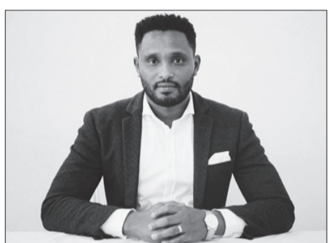
አት መልካም ጥሩነህ

በመዲናዋ እየተሰጠ ባለው የከረምት ነፃ የቅድመ በሽታ የመከላከልና መደበኛ የሕክምና አገልግሎት ሥራ ምርመራ ከተደረገላቸው 112 ሺህ 624 ሰዎች ውስጥ 64 ሺህ 826 አዋቂዎች፤ 27 ሺህ 807 የሚሆኑት ሕፃናት ሲሆኑ እናቶችና ወጣቶችም ይገኙበታል ተብሏል።