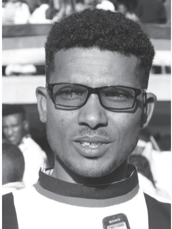
ወጣት መርጋ ሶራሳ