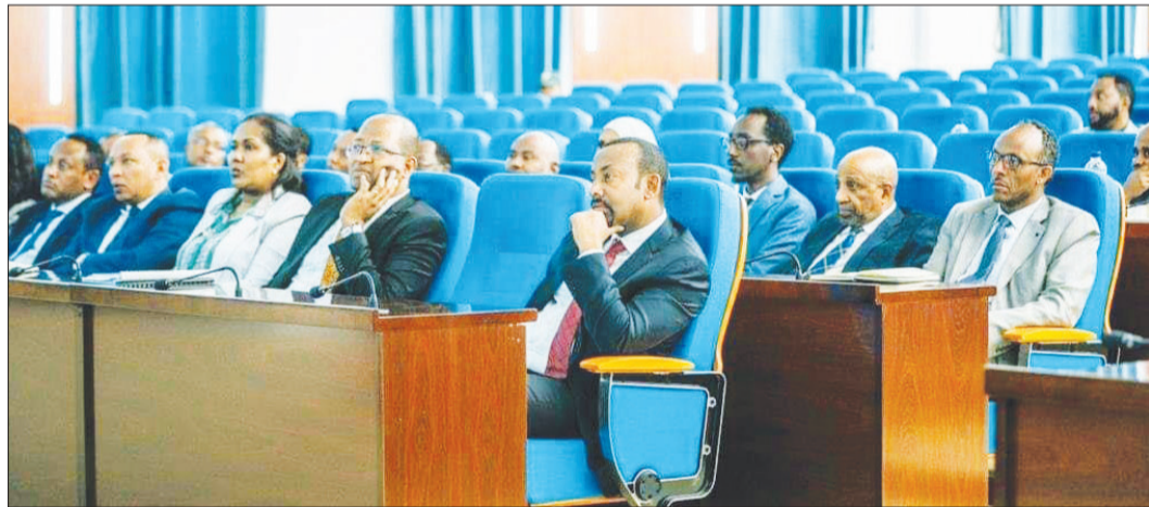
ሀገራዊ የምክክር ኮሚሽኑ ስነ-ምግባር የመንግሥት የሥራ ኃላፊዎች ሪፖርት አቅርቧል

ጠቅላይ ሚኒስትሩ በማኅበራዊ ትስስር ገገቸው ሲሆኑት መልዕክትም ዛሬ የኢትዮጵያ ሀገራዊ ምክክር ኮሚሽን