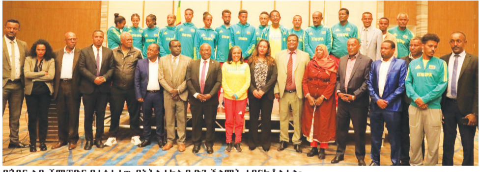
በጎዳና ላይ ቻምፒዮና የተሳተፈው የአትሌቲክስ ቡድን ስልጣን ተበርክቶበታል።

ወጣቷ አትሌት አዲስ በሆነችበት ርቀት በዓለም አታላቅ አትሌቲክስ ቻምፒዮና እንዲሁም ዳይመንድ ሊግ መድረኮች ኬንያዊቷን ተከትላት ከመግባት ባለፈ አሳማኝ በሆነ ብቃት ክብረወሰን በመስበርም ጭምር በታሪክ ለመጀመሪያ ጊዜ በተካሄደው የዓለም የጎዳና ላይ ውድድሮች ቻምፒዮና በአንድ ማይል ፉክክር አሸናፊ ሆናለች። ወጣቷ ኢትዮጵያዊት ይህን ታሪካዊ ውጤት አስመዘገባ ወደ ሃገሯ ስትመለስም «ውድድሩ ካሰብኩት በላይ ነበር፤ ለሃገሬም ሆነ ለራሴ ይህንን ውጤት በማምጣቴ በጣም ደስተኛ ነኝ። ፌይዘ ኪፕሎን በጣም ጠንካራ አትሌት በመሆኗ እሷን ማሸነፍ በመቻሉ በጣም ደስተኛ ነኝ። ሁለት ጊዜ አብራሪት ርጨ ሁለተኛ ደረጃን ይገጥሟል ነበር ያጠናቀኩት፤ በዚህ ውድድር ላይም ስለሸነፍኩት ደስተኛ ነኝ። በቀጣይም ከዚህ የተሻለ በመስራት ለራሴና ለሃገሬ የሚያስደስትና ከዚህ የተሻለ ውጤት ለማስመዘገብ ጥረት