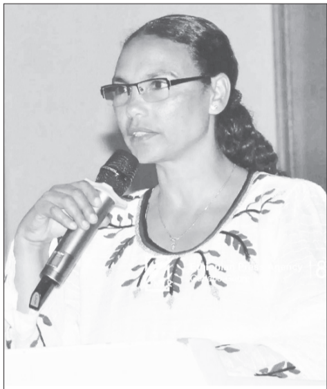
የላንዳቸው ጠንካራ ሕዝቦች መኖሪያ መሆኗንም ጠቁመዋል።