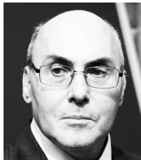
ስኮቪድ ክትባት ከፍተኛ አስተዋጽኦ ያበረከቱ ሳይንቲስቶች የኖቤል ሽልማትን አሸነፉ

ይህ ቴክኖሎጂ በሰው ልጅ አካል ውስጥ እንደ አስተርጓሚ ሆኖ የሚሠራ ነው። ቴክኖሎጂው የሰው ልጅ ዘረመል (ዳኤኒኤ) ላይ ያሉ መረጃዎችን ተንትኖ ለመረዳት የሚያስችል ነው። የሚገኘውን መረጃ መሠረት በማድረግም የሰው ልጅን የሚያጋጥሙ የጤና ጠንቆችን በዝርዝር በመረዳት፣ ተፈጥሯዊው በሽታን የመከላከያ ሥርዓት ሻይረስ ወይም ባክቴሪያዎችን ለመቀጋት