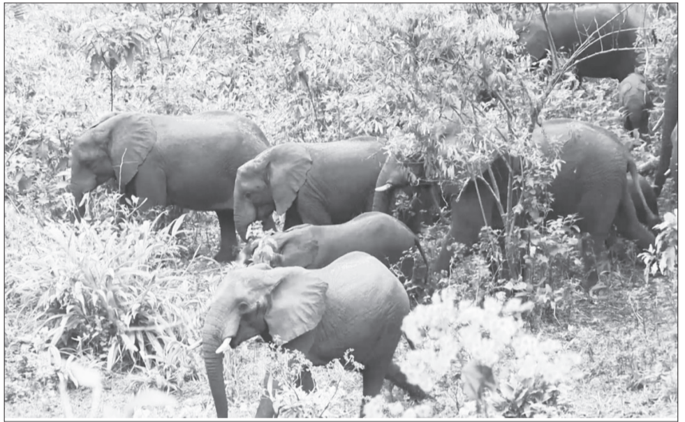
የጨበጫ ጩጩራ ብሔራዊ ፓርክ

በጨበጫ ጩጩራ ፓርክ የሚገኙ የተፈጥሮ ሀብቶች ዓይነትና ብዛት አስደናቂ ነው ሲሉ የገለፁት ሚኒስትር ዴኤታዋ፣ በተለይ በርካታ የዱር እንስሳት