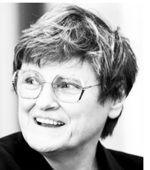
ስኮቪድ ክትባት ከፍተኛ አስተዋጽኦ ያበረከቱ ሳይንቲስቶች የኖቤል ሽልማትን አሸነፉ