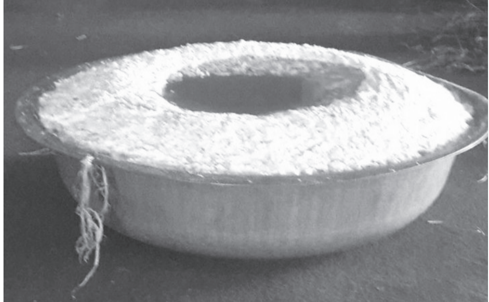
አተካና ከስልጤ ባህላዊ ምግቦች አንዱ ነው

የተጀመረውን የጥናት፣ ምርምርና ሥልጠና የቱሪዝም ማሰልጠኛ ኢንስቲትዩትን፣ የወራሪ የኒቨርሲቲን እንዲሁም ወራሪ ያለውን የቴክኒክና ሙያ ተቋም ይዞን አብረን እንሠራለን ያሉት ሚኒስትር ዴኤታው። ከችግሮቹ አንድ ሁለቱ በኢንስቲትዩቱ ጥናት መፈታታቸውንም ጠቅሰዋል። ኢንስቲትዩቱ የቱሪስት ካርታ መሥራቱን