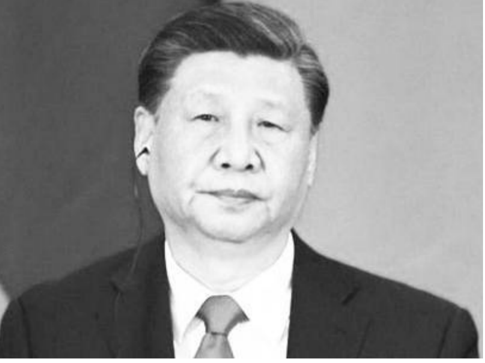
የቻይና ፕሬዝዳንት ሺ ጂንፒንግ

ቤይጂንግ ከቅርብ ወራት ወዲህ በታይዋን ላይ “ዲፕሎማሲያዊ፣ ፖለቲካዊ እና ወታደራዊ ጫናዎችን አጠናክራለች” ሲል ፔንታጎን ጨምሮ ዘግቧል። ፕሬዝዳንት ገር፣ አአአ በ2027 ደሴቷን በግዳጅ መልሶ በቻይና ስር ለማስገባት ወታደራዊ አቅማቸውን እንዲያዳብሩ የመከላከያ መሪዎቻቸውን ማዘዛቸውን ተዘግቧል።