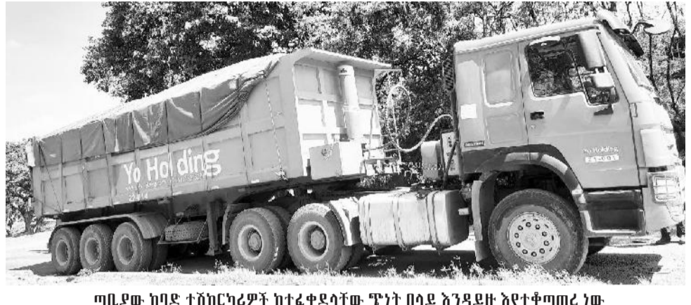
ጣቢያው ከባድ ተሽከርካሪዎች ከተፈቀደላቸው ጭነት በላይ እንዳይዙ እየተቆጣጠረ ነው

የሞገጃ የተሽከርካሪ ሚዛን ጣቢያ በቀን ከ300 እስከ 400 ተሽከርካሪዎችን የመመዘን አቅም እንዳለው ተናግረው፣ በአሁኑ ወቅት ግን ከ80 እስከ 120 ለሚደርሱ ተሽከርካሪዎች ብቻ የ24 ሰዓት አገልግሎት እየተሰጠ እንደሚገኝ አስታውቀዋል። ለአዚህም አንዱ ምክንያት