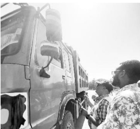
በጣቢያው ግንዛቤ ሲሰጥ