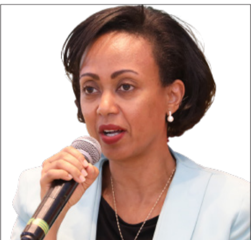
ፎቶ - ዳኝ ሸበሪ