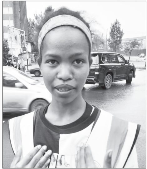
ወጣት ሰላማዊት ነጋም

«የከረምቱ ወር በጎ ፈቃድ አገልግሎት ግንቦት ወር የተጀመረ ሲሆን ሁለት ሚሊዮን የሚጠጉ በጎ ፈቃድኞችን በማሳተፍ የተጀመረ ነው» የሚሉት ኮሚሽኑ፣ በዚህም ሦስት ነጥብ አምስት ቢሊዮን ብር የሚገመት በጎ ፈቃድ አገልግሎት ለመስጠት