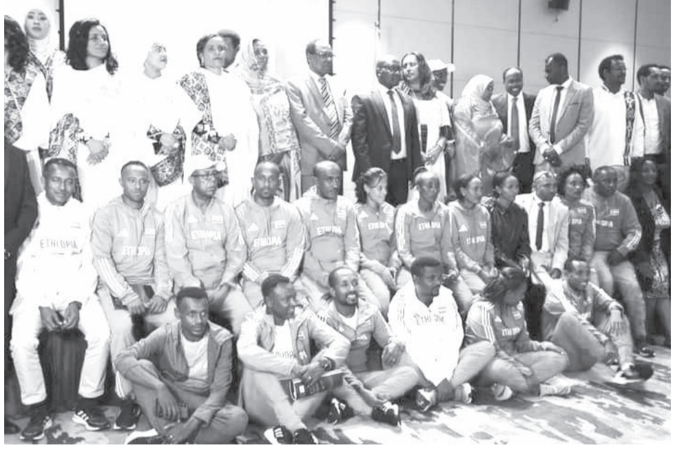
በቡዳፔስት የዓለም ሾሊምፒክ የተሳተፈው ቡድን በፌዴሬሽን ሽልማት ተበርክቶለታል።

በማራቶን ኢትዮጵያ የወርቅ ሜዳሊያ እንድታስመዘገብ የቡድን ስራውን በፊት አውራሪነት የመራቸው አትሌት ያለምዘርፍ የኋላው በመጨረሻዎች ኪሎ ሜትሮች በመድከማ የነሐስ ሜዳሊያ ለጥቂት አምልጧል። ይህን ከክብ አትሌት በውድድሩ ላበረከቸው አስተዋፅኦ ልዩ ተሻሻላ ሆናለች። ያለምዘርፍ በሽልማት ስነስርዓቱ ላይ ባደረገችው ንግግር ውድድሩ በጣም ጥሩ እንደነበር ገልግለች። «ከፊት እየመራን ስለነበር አረንጓዴውን ጎርፍ ለመድገም አስባን ነበር። ግን አልሆነም ሀገራዊ ወርቅ በማግኘቷ ደስተኛ ነኝ» ያለችው ያለምዘርፍ በውድድሩ የገጠማት ፊተና ለሀገሯ ባይሆን ላትጨርሰው እንደምትችል ተናግራለች። በውድድሩ ወቅት የነበረውን ከባድ ሙቀት ልትቆቆመው ካለመቻሏ የተነሳም አምስተኛ ሆና ማጠናቀቅን እንኳን ሀኪሞች ነበሩ የነገሯት።