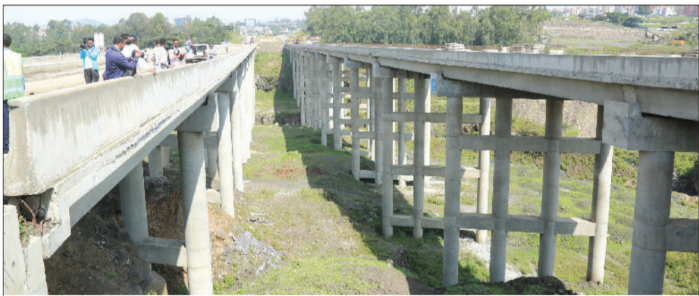
ቃሲቲ ዊሲንጦ ድልድይ