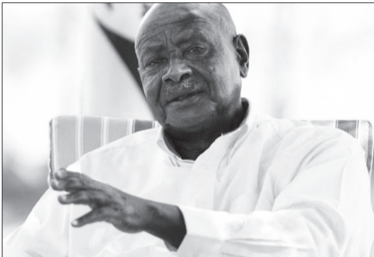
ሶማሊያንድ ከሶማሊያ የተገነጠለችው በፈረንጅቹ በ1991 ቢሆንም የነፃ ሀገርነት ዓለምአቀፍ እውቅና አላገኘችም

ሙሰቬኒ እንደስትራቴጂ ሲታይ ስህተት ስለሆነ መገንጠልን አንደማይደግፉ ገልጸዋል። ይህ ውህደት የአፍሪካ ቀንድን ሶማሊያን የአልሸባብ ጥቃትን ጨምሮ በሌሎች ቡድኖች የሚሰነዘሩ ጥቃቶችን ለመቆቋም አቅም ይፈጥራል።