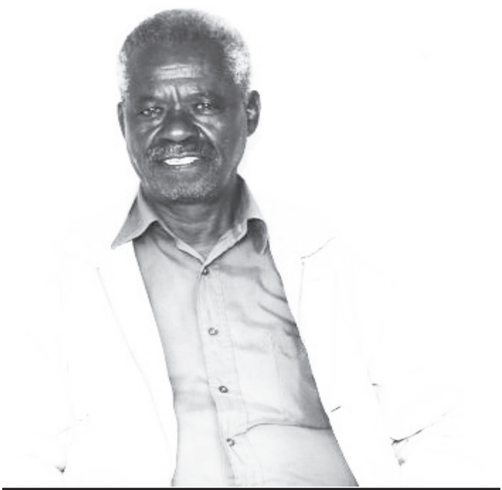
ጋንቶ የቦክስ ዓለምን እንዲቀላቀል የሆነው ፊልም አይቶ ሲሆን፤ የአሜሪካው የቦክስ ውድድር የቦክሱን ስልጠና እንዲወስድ አስችሎታል። አቶ አስጢፋኖስ የሚባሉ ኤርትራዊ አሰልጣኝ ደጃች ወብ ቅጥር ግቢ ውስጥ «አዲስ አበባ ወጣቶች» በሚል ክለብ አድራጅተው የተለያዩ ስፖርታዊ ስልጠናዎችን ይሰጡ ነበርና ከፊልሙ በኋላ በቀጥታ ጊዜ ሳይጠፉ ሄዶ ተመዘገቡ። ልብስ ሰፊቱን ጎን ለጎን በመስራትም ጉጉቱን ወደ ማርካቱ ገባ። ይሁን እንጂ ሌሎች ልጆችን ያሰለጥን ነበርና ቦክስ ማስልጠን አትችልም ተብሎ ታገደ። በዚህም ሥራው ተቋረጠ።

ጋንቶ የተለያዩ ሥራዎችን ሰርቷል። ጨው ነግዷል፤ የፒያሳው ሃብረት ማኅበር ውስጥ ገብቶም የልብስ ዘምዳሚ ነበረ። ልብስ ሰፊም ሆኖ ያውቃል። ከ1968 ዓ.ም በኋላ የቦክስ ውድድርን ሲያቆም ደግሞ የመጨረሻውን አስከለተሞቱ ድረስ ለ50 ዓመታት አሸክርካሪ ነበር። የታክሲ አገልግሎት በመስጠት ሥራውን አህዱ ያለ ሲሆን፤ ቅጥረኝነቱ ሲሰለቸው ደግሞ የራሱን መኪና ገዝቶ የጭነት አገልግሎት መስጠት