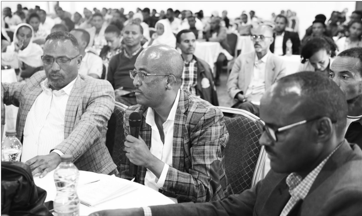
የትግራይ ክልል የቱሪዝም ዘርፍ እንዲያንሰራራ የሚያስችሉ ተግባሮች አየተከናወኑ ናቸው