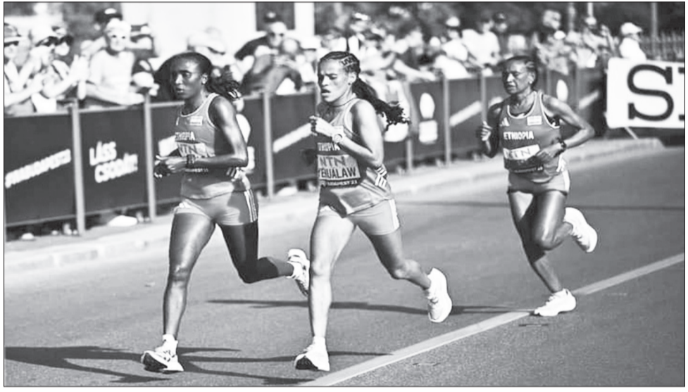
ኢትዮጵያውያን አትሌቶች በሴቶች ማራቶን ደረጃ የቡድን ሥራ የወርቅና የብር ሜዳሊያ አሸናፊ አድርገዋል።

የአምናዋ ቻምፒዮን አትሌት ጎተይቶም ገብረስላሴ 2:24:34 በሆነ ሰዓት የብር ሜዳሊያውን የግሏ ማድረግ ችላለች። እኛ በ2021 የበርሊን ማራቶን አሸናፊ እንዲሁም በቶኪዮ ማራቶን ሦስተኛ ደረጃን በመያዝ ነበር ያጠናቀቀችው። ባለፈው ዓመት የኒውዮርክ ማራቶን በተመሳሳይ 3ኛ ደረጃን በመያዝ ነበር የፈጸመችው።