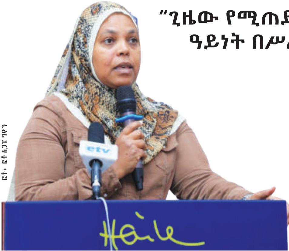
ፎቶ: ፎቶ አጋጥጦ