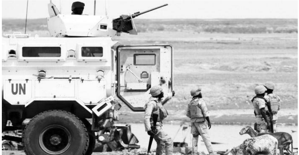
የጸጥታው ምክር ቤት ዲፕሎማት «ይህ የማሊ ውሳኔ ነው። እና እሱን ተግባራዊ ለማድረግ ቢያንስ አስቃቂ ያልሆነውን መንገድ መፈለግ አለብን» ብለዋል። የማሊ የውጭ ጉዳይ ሚኒስትር አብዱላዬ ዲዮፕ በዚህ ወር ለጸጥታው ምክር ቤት አንድተኛነት፤ በተለይም እና በማሊ ባለሥልጣናት መካከል «የመተማመን ችግር» አለ ሲል የዘገበው አል ዓይን ነው ብለው።

እገዳ ተከትሎ መሆኑን ርዕይተርስ ዘግቧል። የተባበሩት መንግሥታት ሰላም አስከባሪ ኃይሎች ሺኖችን የገደለውን የአስልምና አማራያን ለመከላከል ወሳኝ ሚና ተጫውተዋል ተብሏል።