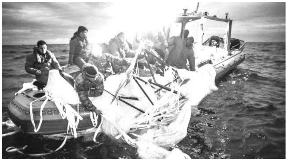
ጄነራል ፓትሪክ ራይሪ። ምልስ ስትሪት ጆርጅና በቅርብ ባወጣው ሪፖርት ይህ የቻይና በራሪ አካል የተሠራው አሜሪካ ሠራሽ ከሆነ ቁስ ጨምሮ ነው ብሏል። የፕሮጀክት ፊት አቀጣይ ግን በዚህ ላይ

በአሜሪካ ሰማይ ላይ ከታዩት በኋላ ተመትታ እንድትወድቅ የተደረገችው የቻይናው ሰላይ ፊኛ ምንም ዓይነት መረጃ አልሰበሰበችም።