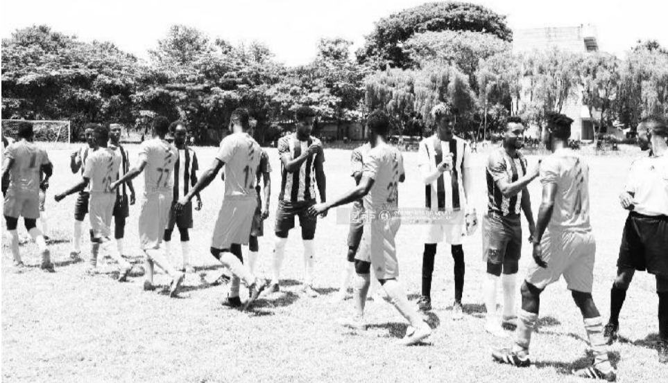
የክልል ክለቦች ቻምፒዮና በሁለተኛው ደታ በሀዋሳ እየተካሄደ ይገኛል።

ከምድብ 1-15ኛ ካምፕ ሀዋሳ፣ ሚቶ፣ ኩርሙ ጉሌ፣ ቤሮ ወርቅ፣ በምድብ 2 ቃላድ አምባ፣ ጎንደር አራዳ፣ ወንዶ ገነት፣ መንጌ ቤኒሻንጉል፣ ምድብ 3 ናቲ ዩኒቲ፣ ቡልቡላ አሜን፣ ዋልያ ድሬዳዋ፣ ሱሉልታ ቢ ምድብ 4 አማያ፣ ቦሌ ገርጂ፣ ገንደ አብዲ ቦሩ፣ ዱል አዛሀቢ፣ ምድብ 5 መታፈሪያ ክፍሌ፣ ደምበጫ ከተማ፣ ቢኢ ከተማ፣ ማያ ሲቲ፣ ምድብ 6 ምቦቦ ዳዲቦን፣ ኛንግላንድ፣ መልካ ኖኖ፣