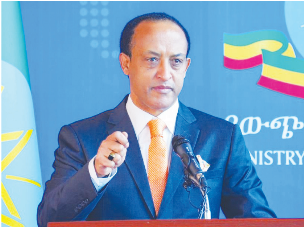
የሱዳን የሰላም ... ወደ ገጽ 4 ዞሯል

ኢጋድ ከሱዳን አንጻር ከፍተኛ ሥራ ሠርቷል ያሉት አምባሳደሩ፤ በመሪዎች ደረጃ በዝርዝር ለመነጋገር ዕድል የሰጠ ስብሰባ ነበር። ኢትዮጵያን ጨምሮ አራት አገራት ለሱዳን መፍትሔ እንዲያፈላገሉ ውክልና ሰጥቷል። በአስር ቀናት ውስጥ የሁለቱንም ተወካዮች ለማግኘት እቅድ አለ፤ የቀጣይ የሰላም ሂደት ድርድሩ በአዲስ አበባ እንዲካሄድም ውሳኔ ተላልፏል፤ ይህ ታሪካዊ ውሳኔ ተደርጎ ይወሰዳል። ኢትዮጵያ ለሱዳን ሰላም የረጅም