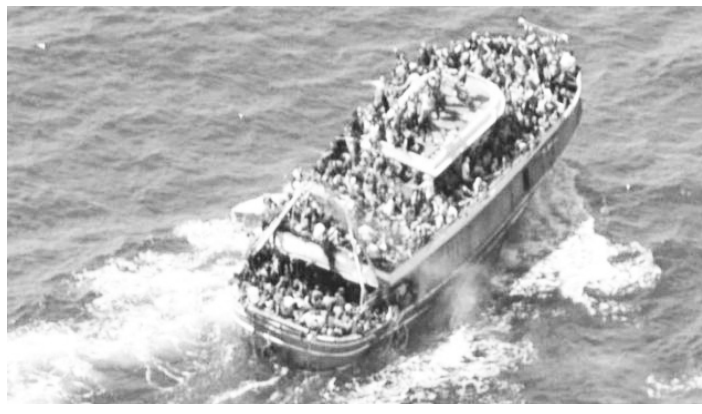
ደዝካን ከተባለ መንደር ነው ብሏል።

የካዋራ ግዛት ፖሊስ 106 ሰዎች እንደሞቱና 144 ሰዎችን ደግሞ መታደግ እንደተቻለ ገልጿል። ጨምሮም ከሚቻሉት ውስጥ ግማሽ የሚሆኑት አቡ ከተባለ መንደር እንደመጡና ሌሎች 38 ሚቻች ደግሞ መነሻቸው በአቅራቢያው ካለ