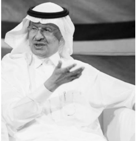
የሳውዲ አረቢያ የጋራ ሚኒስትር ልዑል አብዱል አዚዝ ቢን ሳልማን

ጋር ናችሁ እያሉ ይጠይቁናል” የሚሉት ሚኒስትሩ ሪያድ ከምንኛውም አገር ጋር ጥቅሚን መሰረት ያደረገ ግንኙነት ትመሰርታለች ሲሉም አክለዋል። ቻይና የሳውዲ አረቢያ ዋነኛ ነዳጅ ገዢ አገር ስትሆን ሁለቱ አገራት በየዋን ለመገበያየትም መስማማታቸው ተገልጿል።