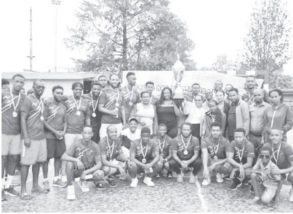
ቂርቆስ ክፍለ ከተማ ስፖርት ግብይት የእጅ ኳስ ፕሪሚየር ሊግ ዋንጫን አንስቷል።

ስምንት ክለቦችን ለአንድ ዓመት ሲያፋልም የቆየው የእጅ ኳስ ፕሪሚየር ሊግ ቂርቆስ ክፍለ ከተማ፣ መቻል፣ አሜድላ፣ ኮልፌ ቀራኒዮ ክፍለ ከተማ፣ ፌዴራል ማረሚያ ቤት፣ ከምባታ ዱራሚ፣ ባህርዳር ከነማ እና ፋሲል ከነማ ጠንካራ ፍክክር አድርገውበታል። በመጨረሻም ሊጉን ዋንጫ በማግኘት ልምድ ያካበተው ቂርቆስ ክፍለ ከተማ በ30 ነጥብ ከማቻል ጋር እኩል ሆኖ በጎል ክፍያ ብቻ በሙብለጥ ቻምፒዮንነቱን አረጋግጧል። መቻልን