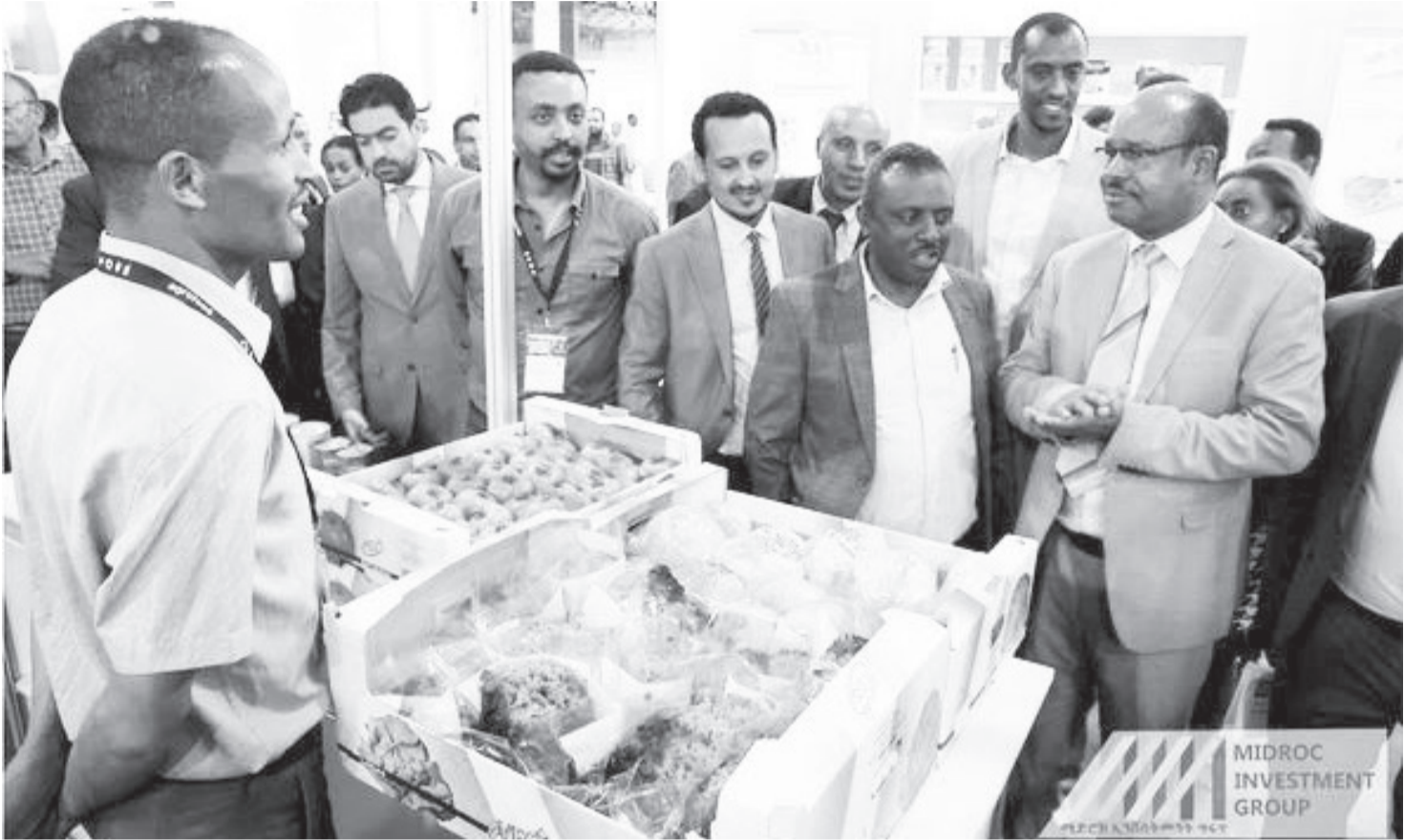
የንግድ ትርዒት በተገኘበት ወቅት