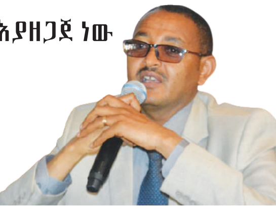
ዶክተር ንጉስ ታደሰ

ይሞከራሉ ተብሏል። የደብረ ብርሃን የኒሸርሲቲ ፕሬዚዳንት ዶክተር ንጉስ ታደሰ ለኢትዮጵያ ፕሬዝዳንት አንደገለጹት፤ ደብረ ብርሃን በተለይ አንኮቦር በሚባለው አካባቢ ከቦታው ታሪካዊነት እና ከመሬቱ አቀማመጥ ጋር ተያይዞ በሀገሪቱ የኒሸርሲቲው ... ወደ ገጽ 4 ዞሯል