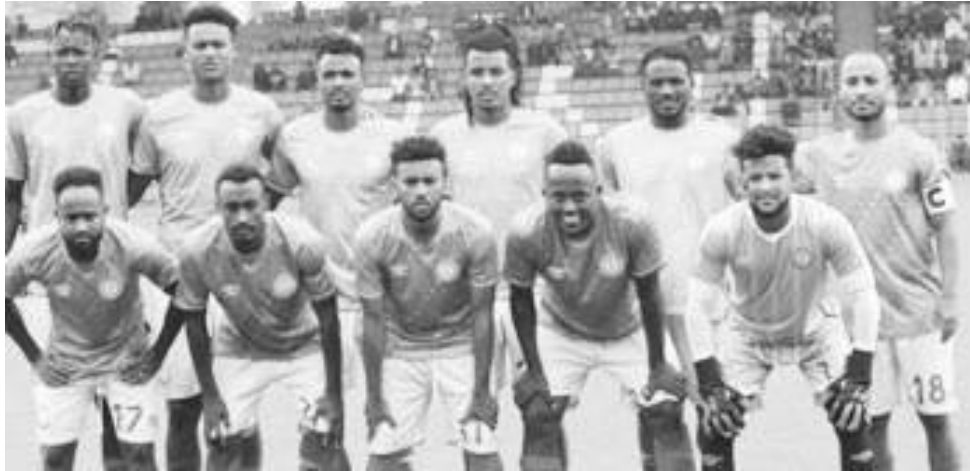
ጥሪ የተደረገላቸው 23 ተጫዋቾች ከትናንት ጀምሮ በአዳማ ይዘጋጃሉ።

ኢትዮጵያ በምድብ ካደረገቻቸው አራት ጨዋታዎች ማሸነፍ የቻለችው አንዱን ሲሆን በሶስቱ