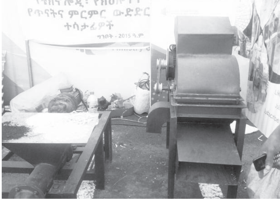
«ፕሮፎሰር ጁሊፍሎላ» የተገኘውን የአረም አይነት ስተሰይዩ አገልግሎት በማዋል ለማጥፋት የሚያስችል የፈጠራ ቴክኖሎጂ

ቴክኖሎጂውን ከቴክኒክና ሙያ ባሻገር በኢንተርፕራይዞችም ሆነ በሌሎች አካላት መስፋፋትና ወደ ተጠቃሚው ማድረስ ስጦታ ለሚሉት መምህራን፤