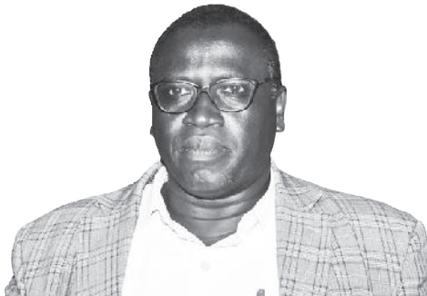
አቶ ባለቤቱ ሀሳብ