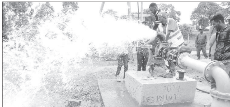
ኅብረተሰቡ ተጠቃሚ ያደረጉ የውሃ ፕሮጀክቶች ወደሥራ ገብተዋል

በ2015 በጀት ዓመቱ ወራት በግል ባለሀብቶች እገዛ ለ26 የስፖርት ማዘውተሪያ ስፍራዎች ዕድሳት ተከናውኗል።