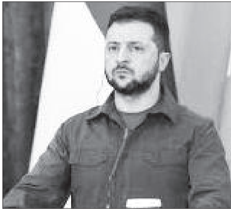
ፕሬዚዳንት ቮሎድሚር ዜሊንስኪ

ፕሬዚዳንት ቮሎድሚር ፑቲን አርብ ዕለት በተሰራጨ ሺዲዮ ላይ ሲናገሩ፣ የየክሬን መልሶ ማጥቃት መጀመሩን ገልጸው፣ የሩሲያ ኃይል በየክሬን ጦር ላይ ከፍተኛ