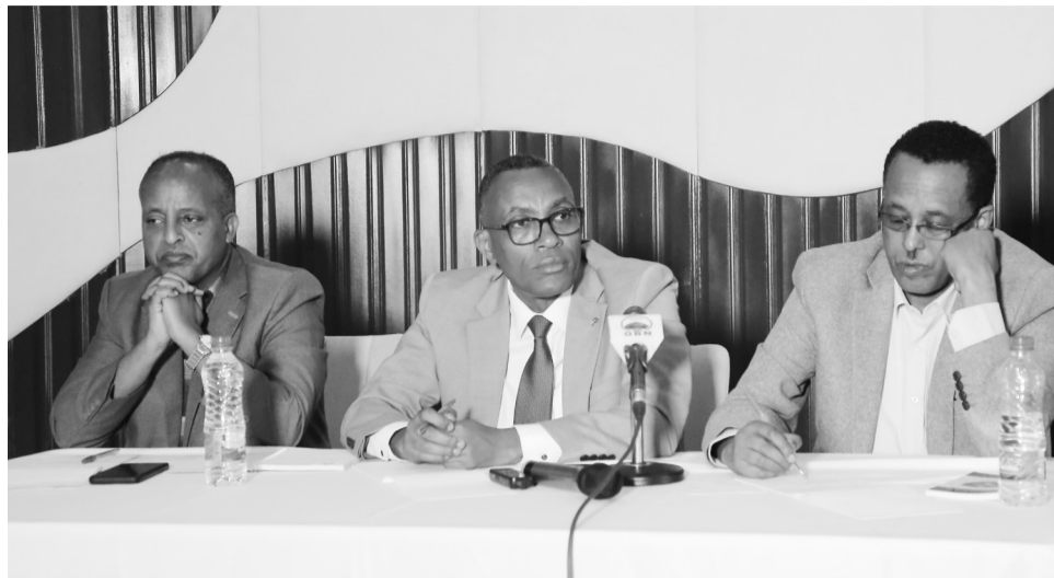
ሰሚቀረጸው ፖሊሲ ከተሰባሰቡዎች ጉበኤገሳ፣ ከመድረኩም ተጨማሪ ሀሳቦችና ማስረጃዎች ተሰጥተዋል

አሉ ያሉት ሚኒስትር ዴኤታው፣ እነዚህን ፈተናዎች በአግባቡ መለየት፣ የሚፈቱበትን መንገድ ማስቀመጥና ዘርፉ ለአገር ማሰርከት ያለበትን አስተዋጽኦ እንዲያበረክት ማድረግ ይገባል ብለዋል። የኮንስትራክሽን ኢንዱስትሪውን አሁንም ችግሮች በመፍታት የኢኮኖሚ እድገት ፍላጎትን የሚመጥን የኮንስትራክሽን ኢንዱስትሪ ዘርፍ ለመፍጠር የዘርፉን ችግሮች የሚፈታና የእድገት ፍላጎትን የሚመጥን የአሰራር ስርዓት መዘርጋት ወቅቱ የሚጠይቀው አንገብጋቢ ጉዳይ መሆኑንም አስታውቀዋል።