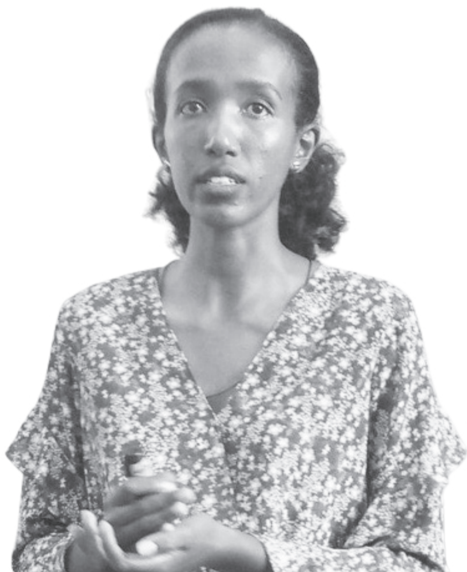
ዶክተር ፍላጎት ታደሰ።

ከሌሎች በእርግዝና ወቅት ከሚከሰቱ የደም ግፊቶች /preeclampsia/ የሚለየው በእናቶችና