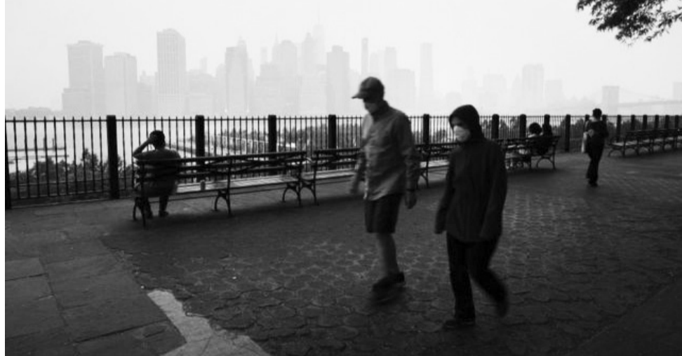
እንደሚቻል የገለጹት የንብረተሰብ ጤና ባለሙያዎች ሰዎች ወደ ውጪ እንዳይወጡ አሳስበዋል። እየታየ ካለው የሰደድ አሳት የሚወጣው ጭስ ለተዛባ የልብ ምት፣ ለደረት

በጭሱ ምክንያት የኒውዮርክ መገለጫዎች ለእይታ አስቸጋሪ ሆነዋል። ጭሱ ፈጣንና ዘላቂ የጤና ጉዳት ሊያመጣ