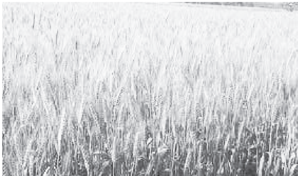
ዘመናትን ሲባክኑ በኖረ የበጋ ወቅት ስኬት እንደገና ይደገማል