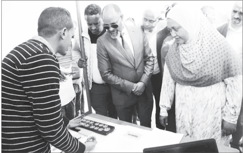
አውደ ርዕይ ሲገነባ