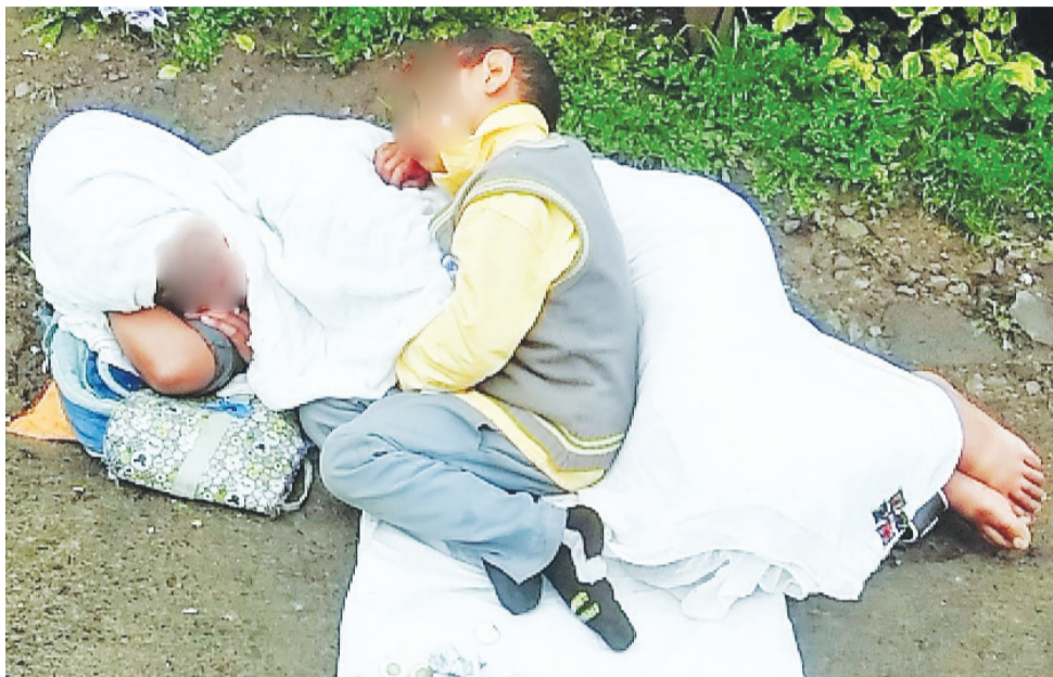
በአስረዎ ተደፍሮ የበሽታ ቁራኝ ለመሆንና ጎዳና ለመውደቅ የተገደደችው ወጣት የሚደገፈት ወገን ትሻሽች።

የህፃን ልጅም ሆነ የእሷ ልብስ ሁሉም የፀዳ ነው። እናትና ልጅ በመልክ ብስል ይሉት ቀይ ናቸው። ሁለቱንም አስተውሎ ላይቸው የፊታቸው ገጽታ በሰም እንደተቀባ ወለል ያንገባርቃል። ውብ መልክና ቁመና ይዘው ካልታሰቡ ቦታ መገኘታቸው ሁሉንም ያስደነግጣል። ሁለመናቸው አበባ ቢመስልም የፅግ ፋንታ ነገር ከማይሆን ቦታ ጥሏቸዋል። ቅዳሜና እሁድ ሙሉ ቀን፤ ከሰኞ እስከ ዓርብ ደግሞ ከዘጠኝና ከአስር ሰዓት በኋላ አራት ኪሎ-ብርሃንና ሰላም ማተሚያ ድርጅት አጥር ስር በአሳዛኝ ሁኔታ ተኝተው ሲለምኑ ማየት በእጅጉ ያሳዝናል። ብዙ ጊዜ ህፃን ልጅ የትምህርት ቤት ዩኒፎርምን እንደለበሰ ጋቢ ተከናኝቶ መሬት በምትተኛው እናቱ ላይ ጋደም እንዳለ አንቅልፍ ወስዶት ሲታይ ይበልጥ የአላፊ አግዳሚውን አንጀት ይበላል። በዚህ ሁኔታ ያያቸው ማንም መንገደኛ ስለነሱ ምንም ሳይነግረው የቻለውን እየመፀወት ያልፋል። እነሱን የሚያዩ አብዛኛዎች በሀዘኔታ ከንፈራቸውን እየመጠጡ፤ ራሳቸውን እየነቀቁ ያልፋሉ። ሁኔታቸውን ልብ ብሎ ላጤነ የእናትና ልጅ ገጽታ ከማሳዘን አልፎ የማግኘት እውነት ይረዳል። ይህኔ «መልክ ገንዘብ አይሆን አይበላ» ማለቱ አይቀርም። እርግጥ ነው እናትና ልጅ ውብ ናቸው። ልብሳቸውም ለልመና የወጣ ሰው አይነት አይደለም። ፀሐዳና ገጹ ነው። እናም «ለምን ጎዳና ላይ ወጥተው ልመናን መረጡ? የሚለው የበርካታ ሰዎች ጥያቄ