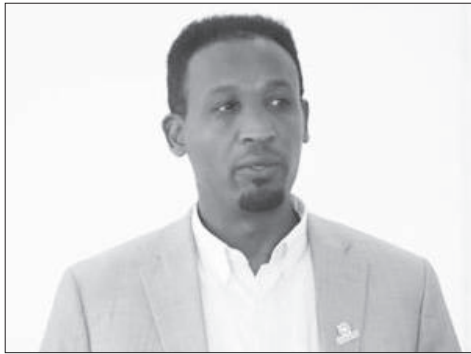
ሐብ አሻግሪ ጅንበራ