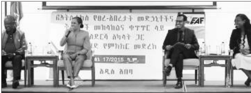
በስፖርቱ የተከለከሉ ወደ 10 የሚደርሱ ቅመሞችና መድኃኒቶች ጥቅም ላይ እየዋሉ እንደሚገኙ ተጠቁሟል።

ሁሉም ባለድርሻ አካላት በተገኙበት የምክክር መድረክ በአትሌቲክስ ፌዴሬሽንና በኢትዮጵያ ፀረ አበረታች ቅመሞችና መድኃኒቶች ቁጥጥር ባለስልጣን አማካኝነት የአበረታች ቅመሞችና መድኃኒቶችን ስጋት የሚዳሰሱ የመነሻ ጽሑፎች ቀርበው ውይይት ተደርጎባቸዋል። በቀረቡት የመነሻ ጽሑፎችም አበረታች ቅመሞችና መድኃኒቶች (ደገንግ) አትሌቲክስ ከሁሉም ስፖርቶች በበለጠ ቀዳሚው ተጋላጭ እንደሆነ ተመላክቷል። የመነሻ ጽሑፎቹ ቀርበው ውይይት ከተደረገባቸው በኋላም የመፍትሄ አቅጣጫዎች ተቀምጠዋል። በስፖርቱ የተከለከሉ ወደ 10 የሚደርሱ ቅመሞችና