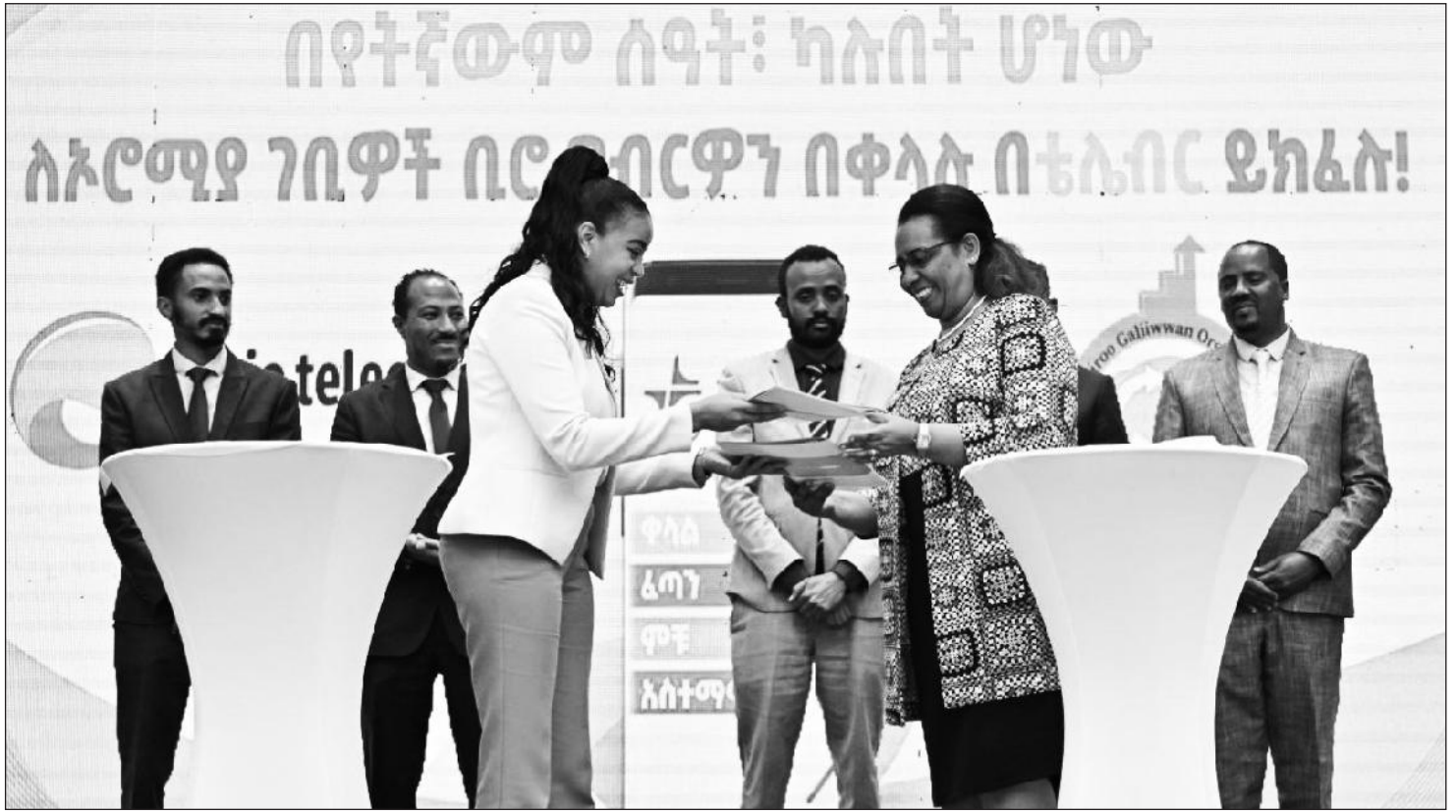
የመገባቢያ ስምምነት በተፈረመበት ወቅት፤

አሳቸው እንደሚሉት፤ የዲጅታል ክፍያ ሥርዓቱ እስካሁን በክልሉ አራት ዞኖች ተግባራዊ ተደርጓል። በቴሌብር ታክስና ቀረጥ የመሰብሰብ ሥራ ተጀምሯል። እነዚህ ዞኖች 39 ሺ የሚሆኑ ግብር ከፋዮች ያሏቸው ሲሆን፤ ከ40ሚሊዮን ብር በላይ በቴሌ ብር መሰብሰብ ተችሏል። በተጨማሪም በሽግግር ከተማ፤ በአዳማና በቢሮኖቱ እንዲሁም በዋናው መስሪያ ቤት ባሉ ትልልቅ ግብር ከፋዮች በኢብር፤ የኢታክስ እና የኢፋይሊንግ