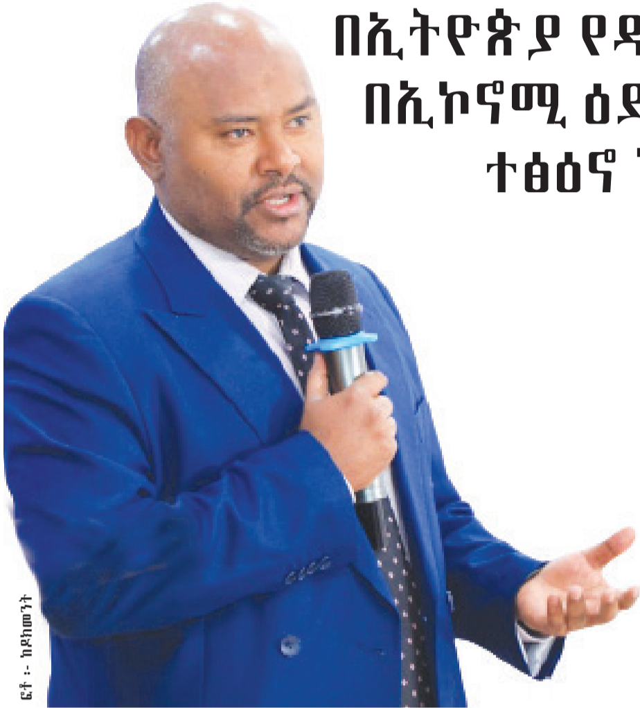
ፎቶ - ከደክመንት