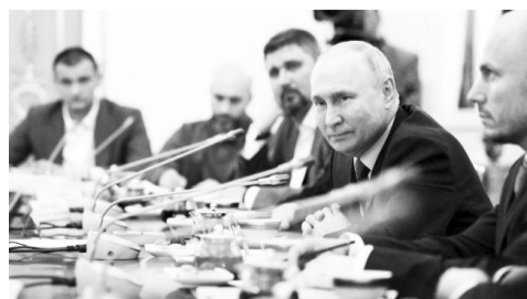
በተጨማሪም ፑቲን ምንም እንኳን ከባለፈው ዓመት ወዲህ የጦር መሳሪያ ምርት ቢጨምረውም ጦራቸው፣ “የተተካኝ፣ የግንኙነት መሳሪያ፣ ድርጎን እና የመሳሰሉት” አጥረት እንዳለበት አልካዱም።

ፑቲን በትናንቱ ንግግራቸው የክሬን በድንበር ዘለል ጥቃቶች ሩሲያን ዓለማዊ ያደረገችባቸውን ጥቃቶች ለመመከት የጦር ኃላፊዎቻቸው የተሻለ ዝግጅት ማድረግ ይችላሉ ነበር ሲሉ መከላከሉ ላይ ከፍተኛ መኖሩን አምነዋል። ከዚህ