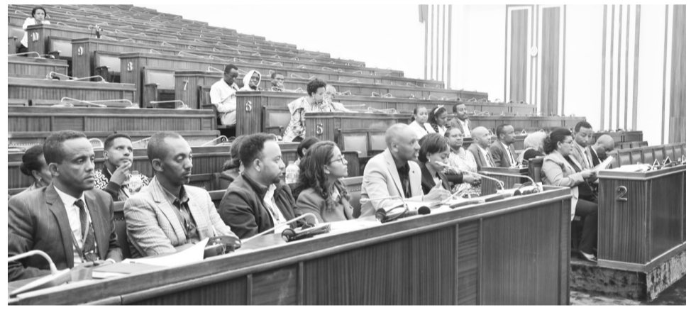
ቋሚ ኮሚቴው ገምገማ ሲያካሂድ

ኤክስፖርት የተዘጋጀው በሴቶችና ማህበራዊ ጉዳይ ሚኒስቴር እና በማሌሳ ኢቮንትስ ጥምረት መሆኑ ታወቋል።