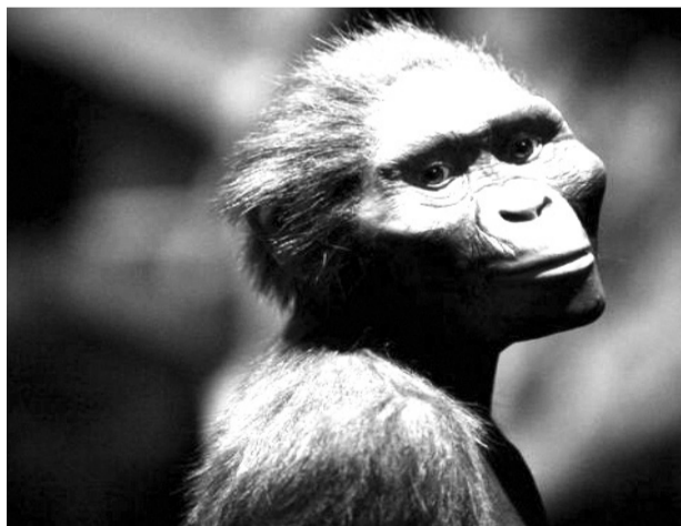
ተመሳሳይነት የለውም። የሰው ልጆች እግሮቻቸው ቀጥ ብለው ስለሚቆሙ ሚዛናቸውን ጠብቀው

ይህም ማለት ሱሲ የነበራት የሰውነት አቋም በአሁኑ ወቅት ካለ ከየትኛው ፍጥረት ጋር