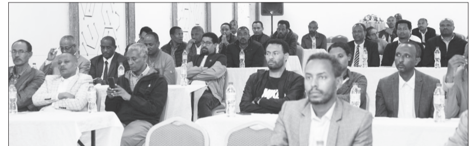
ሰፊ ስልጠናና ቴክኖሎጂ ሚኒስቴር አመራሮች ሥልጠና ሲሰጥ

በተለይ በቀጣይ በጀት ዓመት ሚኒስቴር መሥሪያ ቤቱ ውጤታማ ሥራዎችን ለማከናወን አዲስ መቅቅር ተግባራዊ እያደረገ በመሆኑ ሥልጠናው ጠቀሜታው የጎላ ነው ሲሉ ገልጸዋል። ሥልጠናው እያንዳንዱ የተቋሙ ሠራተኛ