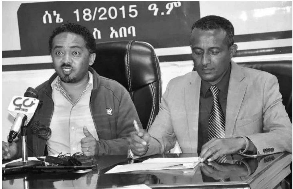
ውድድሩን የተሳካ ሰማድረግ ዝግጅቱ መጠናቀቁን ፌዴሬሽኑ በሰጠው መግለጫ አስታውቋል።

በሁለተኛው ጾታ ከሽልማት አስተዳደር ደረጃ ለሚወጡ አትሌቶች የወርቅ፣ ብርና የነጠላ ሜዳሊያዎችን ከመሸለም በተጨማሪ እንደየደረጃቸው የገዝብ ሽልማት ይበረከታሉባቸዋል። በሁለቱም ጾታ ከ1ኛ-8ኛ በመውጣት