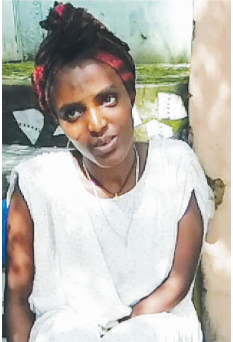
ተራምዳለች። ከእንግዲህ ምኞት ፍላጎቷን መሙላት የእሷ ድርሻ ይሆናል።