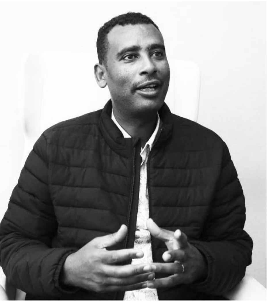
ጭፍፍ፡- ጸጋጊ ገደግ

እንደሚታወቀውና በተለያዩ የመገናኛ ብዙኃን እንደምንሰማው ኢትዮጵያ በከርሰ ምድር የማዕድን ሀብት በተለይ ነዳጅ እንዳላት ይታወቃል። ይህም ተስፋ ሰጪና አበረታች ነው እየተባለ ሲነገር ይሰማል። ነገር ግን ከነዳጅ ባልተናነሰ የሚያገለግለን ያለንን የውሃ ሀብት በአግባቡ መጠቀም ስንችል ነው ባይ ነኝ። በዚህ ብዙ ነገሮችን መቀየር እንችላለን ብዬ አምናለሁ።