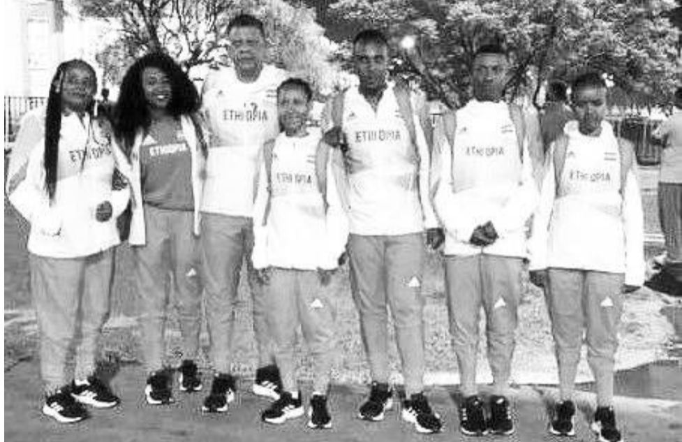
በስፔሻል ኦሊምፒክ ኢትዮጵያን የሚወክለው ቡድን በሮሊን ሲደርስ አቀባበል ተደርጎለታል።

የኢትዮጵያ ቡድን በዓለም ስፔሻል ኦሊምፒክ መሳተፍ ሀገሪቱ የአካል ጉዳተኞችን ማካተት እና የአዕምሮ እኩል ያለባቸውን ስፖርተኞችን ለመደገፍ ያለውን