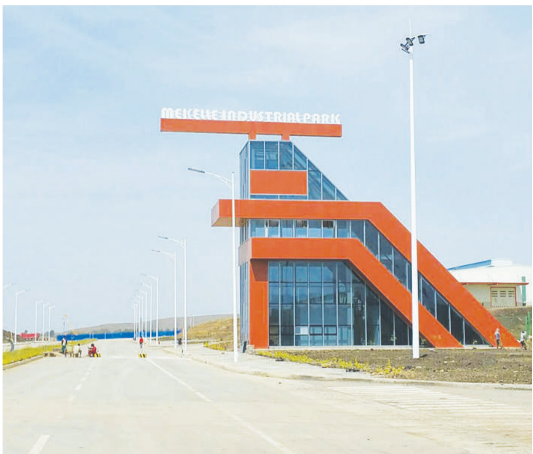
የመቀሌ ኢንዱስትሪ ... ወደ 78 4 ዞሯል

በኮርፖሬሽን የተቋቋመ ቡድን በታወላይ ተደጋጋሚ ጉብኝት በማድረግ ነባራዊ ሁኔታውን የማየትና መሟላት ያለባቸውን ጉዳዮች በተመለከተ በኮርፖሬሽን ደረጃ ውይይቶች እንደተደረገበት ገልጸው፤ ጎን ለጎንም ፓርኩ ውስጥ መዋዕል ንዋዮቻቸውን ያልሰሱ ባለሀብቶች ተመልሰው ሥራቸውን እንዲቀጥሉ የሚያስችሉ ውይይቶች ተደርገዋል፤ ባለሀብቶችም ደስተኛ ሆነው ሥራ