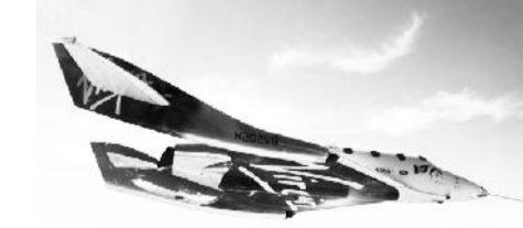
አመለካታል። "ሁሉንም ነገር እናጣለን ብዬ ያሰብኩበትም ጊዜ ነበር" ሲልም አክሏል። ሆኖም ሰውዬው ቢሊዩር ሆኖ መቆየት ችሏል። ባለፈው ሁሉ የወጣው የታይምስ ባለጸጎች ዝርዝር ሰር ሪቻርድ ብራንሰን 2 ነጥብ 9 ቢሊዩን ዶላር የተጣራ ሀብት አለው ሲል የዘገበው ቢ.ቢ.ሲ. አማርኛ ነው።

ሰር ሪቻርድ ባለፈው ወር ለቢ.ቢ.ሲ. በሰጠው ቃለ መጠይቅ በግሉ ዩ.ፓ ቢ.ዲ.ዲ.ና ዶላር አንድገጠመው ገልጿል። ባለሀብቱ የዚህ ኪሳራ መነሻ በኪ.ዲ.ና 19 የአንቅስቃሴ ገደብ ምክንያት የአየር መንገድና የመዝናኛ ግግቶች ያጋጠማቸው ኪሳራ እንደሆነ