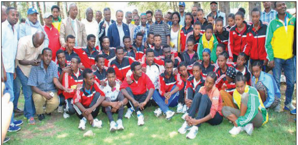
የተንታ አትሌቲክስ ማሰልጠኛ ማዕከል ከ60 በላይ አትሌቶችን አቅፎ በማሰልጠን ላይ ይገኛል።

የኒቨርሲቲው ከደቡብ ወሎ ዞን አስተዳደር እና ከተንታ ወረዳ አስተዳደር ጋር የሦስትዮሽ ስምምነት በመፈራረም ከታኅሣሥ 9 ቀን 2008 ዓ.ም ጀምሮ የተንታ አትሌቲክስ ማሰልጠኛ ማዕከልን በፕሮጀክት