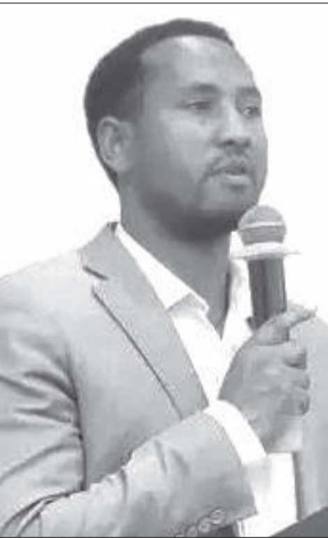
የትምህርት እና የሚዲያ ተቋማት ትልቁን ድርሻ ሊወስዱ ይገባል ያሉት ምክትል ኮሚሽነር፣

የሙስና የስር መሠረት የሆነውን የሥነ ምግባር ዝቅጠት በጋራ ልንሠራና ልናስወግደው ይገባል ብለዋል። ከባለድርሻ አካላቱ መካከል የሃይማኖት፣