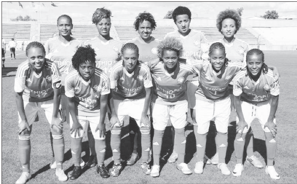
ሱሲዎች ስ2024 የሱሲዎች ጨዋታዎች የማጣሪያ ዝግጅታቸውን በአዲስ አበባ ያደርጋሉ።

አገራት እንደየደረጃቸው ማጣሪያ ከሚያካሄዱባቸው ስፖርቶች ውስጥ እግር ኳስ አንዱ ነው። ኢትዮጵያም በሱሲዎች እግር ኳስ በአሊምፒክ ለመሳተፍ በአፍሪካ ዞን የማጣሪያ ጨዋታዎችን ታደርጋለች። የአፍሪካ ሱሲዎች የእግር ኳስ ማጣሪያ ውድድሩ አራት ዙሮች ያሉት ሲሆን የመጀመሪያ ዙር ማጣሪያ ከሐምሌ 3-11 2015 ዓ.ም ይካሄዳል። የኢትዮጵያ ብሔራዊ ቡድን (ሊሲዎቹ) የመጀመሪያ ዙር የማጣሪያ ጨዋታቸውን በተጠቀሰው ጊዜ ውስጥ ከቻድ አቻው ጋር የሚያደርጉ ይሆናል። ሊሲዎቹ በዓለም አገራት የእግር ኳስ ደረጃ ከዓለም 125 ደረጃን ይዘው ሲገኙ ተጋጣሚያቸው ቻድ በበኩሏ በዓለም የእግር ኳስ ደረጃ ካልተሰጣቸው አገራት