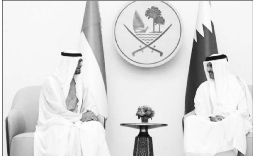
የአረብ ኢምሬትስ ፕሬዝዳንትና የኳታር ኤሚር