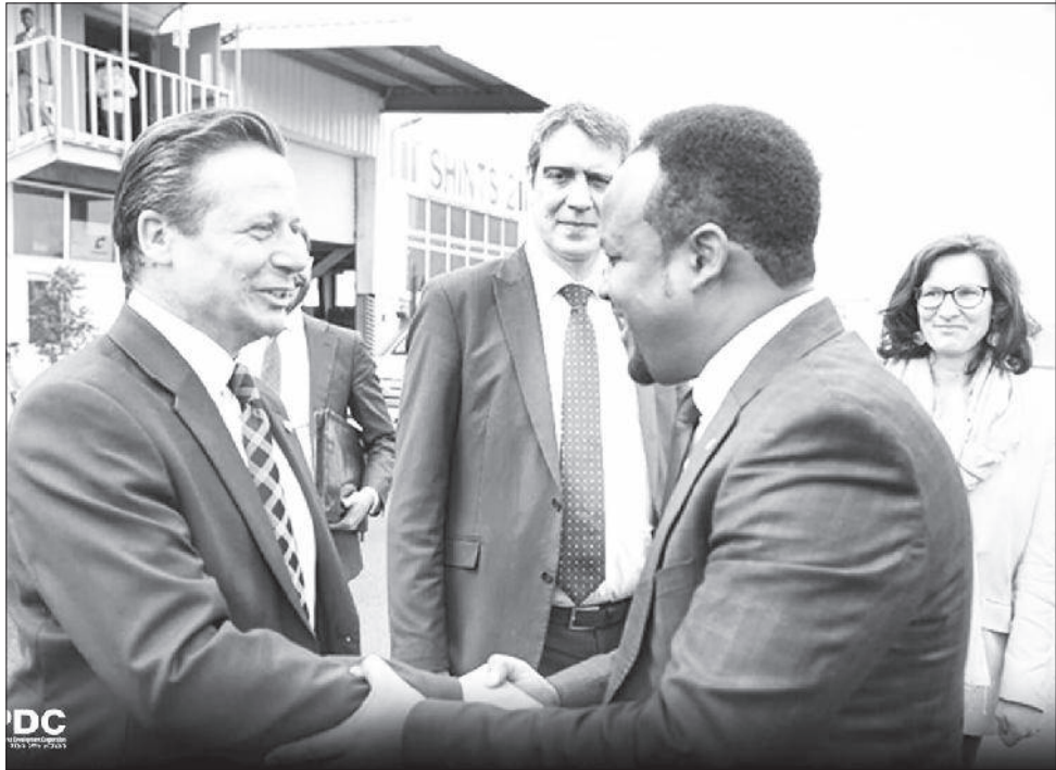
የልዑካን ቡድኑ በቦሌ ሰማ ኢንዱስትሪ ፓርክ ጉብኝት አድርጓል