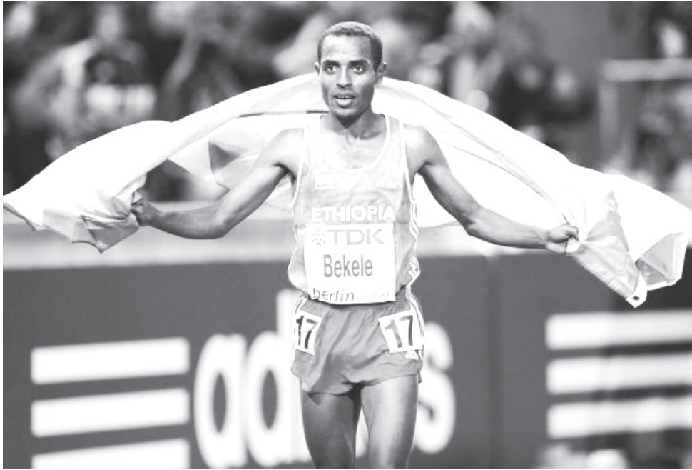
የረጅም ርቀት የምንጊዜም ምርጡ አትሌት ቀንረሰ በቀለ 41ኛ ዓመቱን ስኬታል።

ውድድሮች በርካታ ድሎቹ አገናን አኩርቷል። በተለያዩ ውድድሮች ለኢትዮጵያ 26 የወርቅ ሜዳሊያዎችን አበርክቷል። የ5ሺ እና የ10ሺ ሜትር የዓለም ክብረወሰኖችን ከ15 ዓመታት በላይ ተቆጣጥሮ ቆይቷል። የማራቶንን ሁለተኛ ፈጣን ሰዓት በ2:01:41 ሰዓት ያስመዘገበው ታላቅ አትሌት ዛሬም በርቀቱ ቀዳሚውን ሰዓት ለማስመዘገብ ያለው ፍላጎት አልከሰመም። በፋጫ ዘመኑ ከ120 በላይ ውድድሮችን አሸንፏል።