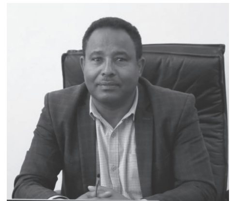
ምክትል ፕሬዚዳንት ዶክተር አሸቱ ወንድሙ

ዩኒቨርሲቲው በየዓመቱ ከሰነድ መቶ አስከ 600 ለሚሆኑ ግለሰቦች መሰል ነፃ የሕግ አገልግሎት ድጋፍ የሚሠጥ ሲሆን ይህ የሚከናወነውም በተለያዩ መልኩ ነው። አንደኛው ማመልከቻዎችን በመጻፍ፣ ጥብቅና በመቆም፣ የሕግ ግንዛቤ እንዲያገኙ በማድረግ እንዲሁም በማዕከሉ ላይ ስልጠና በመስጠት ሰፊ ሥራዎች ተሠርተዋል።