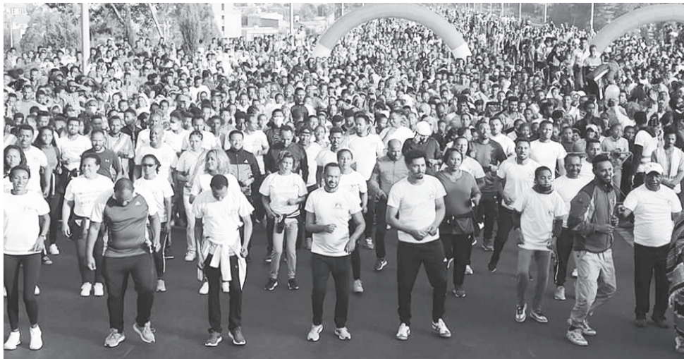
አዘውትሮ ስካላዊ እንቅስቃሴ በማድረግ ጤናን መጠበቅ ባህል መሆን ይገባል።

የማህበረሰብ አቀፍ ስፖርት በአዲሱ የስፖርት ሪፎርም ከዚህ ቀደም ያልተሰራበት በሚል ለይቶ ተቀምጧል። በዚህም መሰረትም በዚህ ዓመት በእንቅስቃሴው ተሳታፊ ለማድረግ የታቀደው 480ሺ የሚሆን የማህበረሰብ አካል በሚኖርበት አካባቢ፤ 280ሺ የሚሆነው ደግሞ በሚሰራበት አካባቢ ተሳታፊ ይሆናል ተብሎ ይጠበቃል።