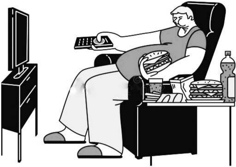
ጤናማ ያልሆነ አመጋገብ ስውፍረትና ተሳሳፊ ሳልሆኑ በሽታዎች ያጋልጣል።

በሌላ በኩል ደግሞ ጣፋጭ ምግቦችን ለአብነትም ብስክፍትን፣ ኪኮችን፣ ከረሜላዎችን፣ ቸኮሌቶችንና ሌሎች መሰል ጣፋጭ ምግቦችን አዘውትሮና በተደጋጋሚ መመገብ ከጥርስ መርበር ጀምሮ ለሌሎች እድሜ ዘለቅ በሽታዎች ያጋልጣሉ። ሆኖም እነዚህን ምግቦች በሌሎች ተፈጥሮዊ ምግቦች ማመጣጠን ከተቻለ ጉዳታቸውን መቀነስ ይቻላል። በተለይ ደግሞ እነዚህ ጣፋጭ ምግቦች በልደትና መሰል ፕሮግራሞች ላይ የሚቀርቡ በመሆናቸውና ህፃናት የሚመገቡባቸው በመሆኑ የህፃናት ጤና እንዲይገዳ በቤተሰብና በህፃናት ላይ የግንዛቤ ማስጨበጥ ስራዎችን መስራት ያስፈልጋል።