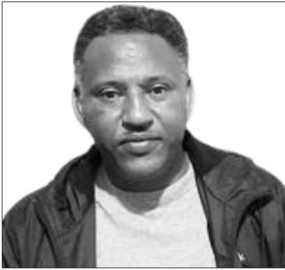
የክተር ጳውሎስ ካሱ