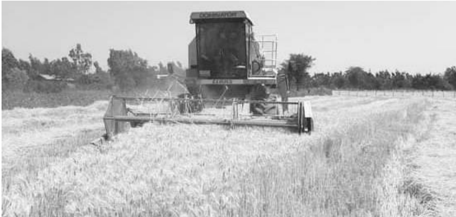
52 ሚሊዮን ኩንታል ስንዴ ለማግኘት እቅድ የተደረገበት የዘንድሮው የበጋ መስኖ ስንዴ ልማት አዝመራ እየተሰበሰበ ነው

እሳቸው እንዳሉት፤ በተያዘው እቅድ መሠረት ሁለት ነጥብ አራት ሚሊዮን ሄክታር በዘር ለመሸፈን ከተያዘው እቅድ፣ እስከ አሁን ባለው አፈጻጸም ወደ 64 በመቶውን በመዘር መሸፈን ተችሏል። በቀሪዎቹ ወራትም (በሚያዝያ