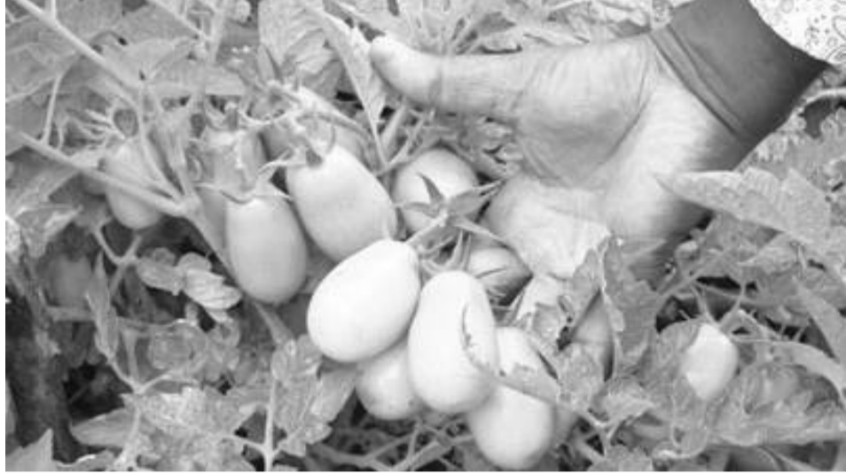
የገላን ልዩ የወንዶች አዳሪ ትምህርት ቤት የከተማ ግብርና።

የትምህርት ቤት ግብርና የትምህርት ላብራቶሪ ነው። ምክንያቱም በመከራና በእይታ ነገሮችን ማረጋገጥ ይቻልበታል። በተለይም የመጀመሪያ ደረጃ ላይ ለሚማሩ ተማሪዎች መሠረት የሚሆን እውቀት የሚያስጨብጥ ነው። ለሁለተኛ ደረጃ ትምህርት ቤት ተማሪዎችም ቢሆን ቀጣይ የሕይወት ማረፊያቸውና መተዳደሪያቸውን የሚወስን ነው።