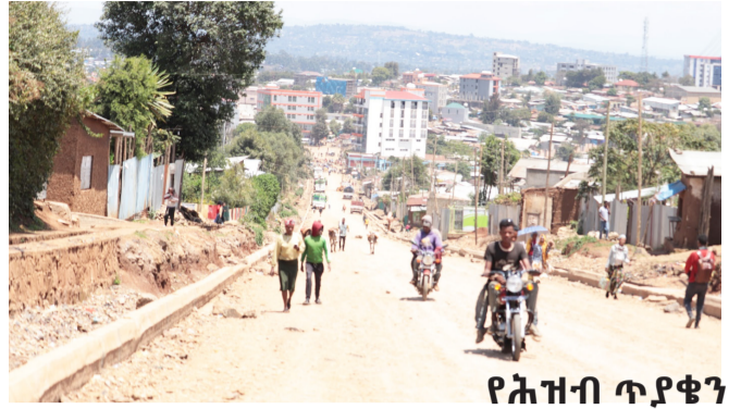
የሕዝብ ጥያቄን የሚመልሰው የመሠረተ ልማት ፕሮጀክቶች ግንባታ በሆሳዕና