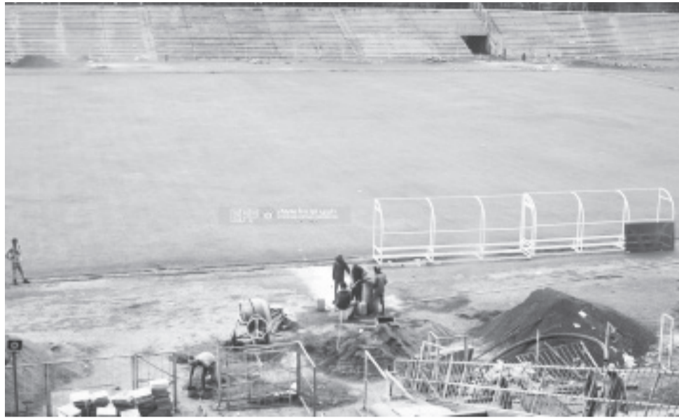
በአዲስ አበባ የእግር ኳስ ስፖርት ደ/ቤት የሚደረግ የስፖርት ማስተካከያ ስራ ላይ የሚገኘውን የአዲስ አበባ ስፖርት ደ/ቤት የእግር ኳስ ሜዳው ላይ ስራውን ጎበኝተዋል።

የአዲስ አበባ ስፖርት ደ/ቤት የእግር ኳስ ሜዳው ላይ የሚደረግ የስፖርት ማስተካከያ ስራ በአዲስ አበባ ስፖርት ደ/ቤት የእግር ኳስ ሜዳው ላይ በሚደረግ ስራ ላይ የሚገኘውን የአዲስ አበባ ስፖርት ደ/ቤት የእግር ኳስ ሜዳው ላይ ስራውን ጎበኝተዋል።