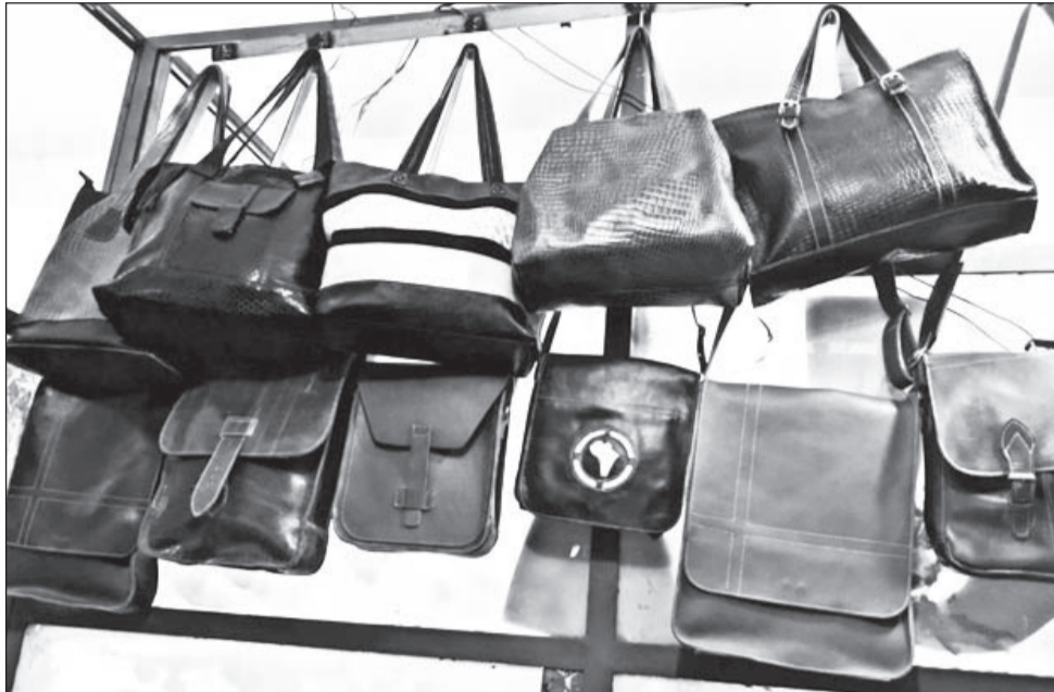
የኢትዮጵያ የቆዳ ውጤቶች ተፈላጊነት እያጨመረ ነው

አሳቸው እንዳሉት፣ የአንበሳ ጫማ ፋብሪካ አብዛኛው ምርት ለውጭ ገበያ የሚቀርብ ነው፤ ምርቶቹም ሦስት ዓይነት ሲሆኑ፣ እነሱም ከፍተኛ፣