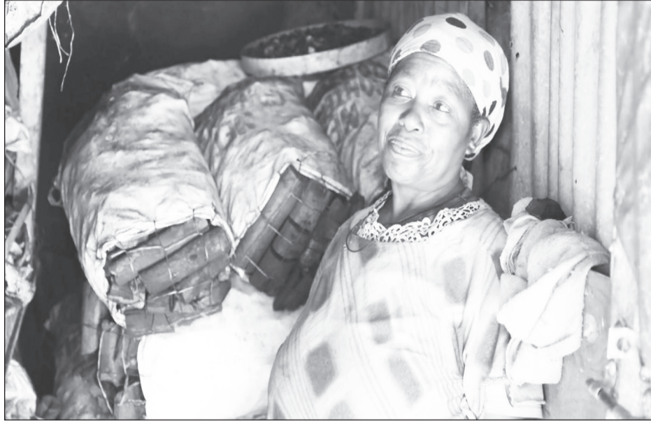
ገጽ 16 ላይ

አንዳንድ ውሃውን የሚያመጣ፣ የሚታዘዝ ይጠፋል። ደጊቱ ምርጫ ሲያጠፍ፣ ስለሥራው ሲጨነቁ ለሸከም ትኩሻቸውን ይሰጣሉ። ዕለቱን እንዳሰቡት ቢሞክሩም ማግስቱን መመለስ አይችሉም። ደጋግሞ ሕመም የጎበኘው አሳቸው ይዘላል።