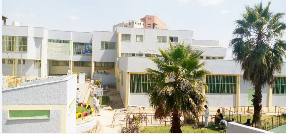
የአማኔኤል የአድምር ስፔሻላይዥድ ሆስፒታል

ባለፉት ተከታታይ እትሞቻችን የሆስፒታሉን አመራራት እና በኢትዮጵያ የአድምር ሕክምና የረጅም ዘመን ገዢ ተቋሙ የሚሰጣቸውን አገልግሎቶች ማስታወሻ ለዘፈው ዝግጅታችንም በስልጠናና ምርምር ዘርፍ የተሰሩና እየተሰሩ ያሉ ሥራዎችን እንዲሁም የላብራቶሪና የመድኃኒት አገልግሎትና የታካሚዎች ሁኔታ እንደሚከተለው አቅርቧል።