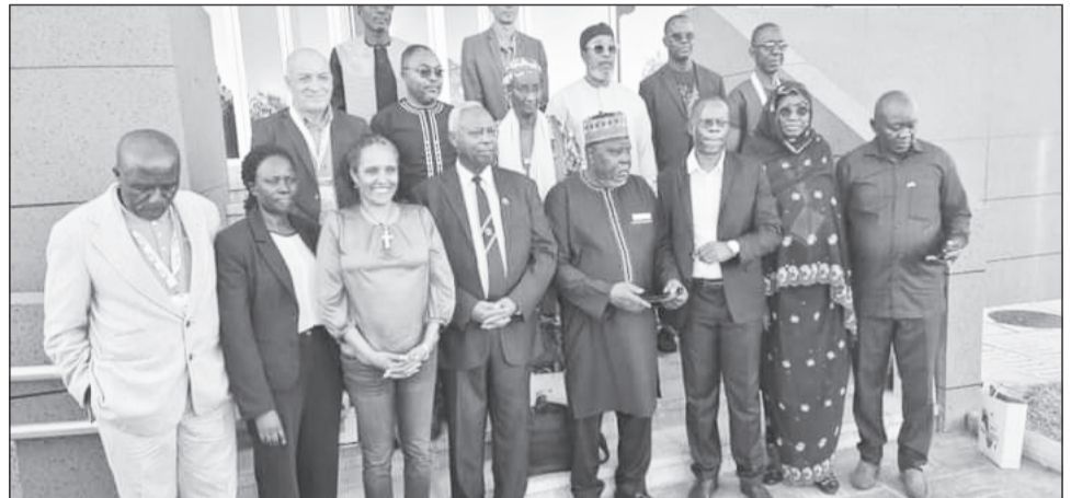
ረዳት ኮሚሽነር ጄነራል ደራርቱ ቱሱ በሰብሰባው ገባዬ የአፍሪካን አትሌቲክስ ምክትል ፕሬዚዳንትነት እንደታገለገለች ተመርጧለች።

ከኮንግረስ ስብሰባው አስቀድሞ የካውንስል ስብሰባ የተካሄደ ሲሆን፤ ኮንግረሱ ሲጀመር የዛምቢያ ስፖርት፣ ባህልና አርት ሚኒስትር፣ የዓለም አትሌቲክስ ፕሬዚዳንት ሎርድ ሳባስቲያን ኮይን ጨምሮ ጥሪ የተደረገላቸው