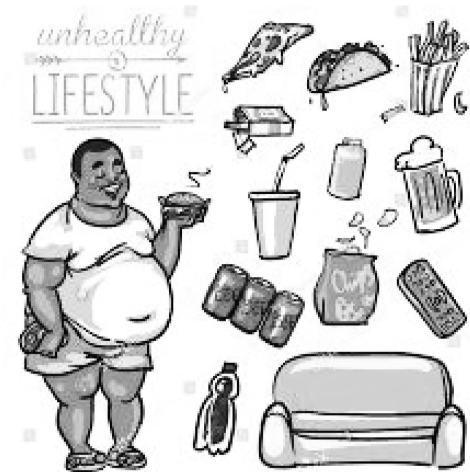
ተላላፊ ባልሆኑ በሽታዎች ሞት ምክንያት ጤናማ የአካል ስርዓት አለመኖሩ ነው።

ተላላፊ ያልሆኑ በሽታዎች ከፍተኛ ባለሞያ ናቸው። እርሳቸው እንደሚሉት ተላላፊ ያልሆኑ በሽታዎችን መቆጣጠር ቢቻልም በህክምና ማዳን ግን አይቻልም። የእድሜ ልክ ክትትልም የሚሹ ናቸው። የነዚህ በሽታዎች ሞት አጋላጭ መንስኤዎች ደግሞ ድህነት፣ ደካማ የአኗኗር ሁኔታ፣ ማህበራዊ መገለል፣ የከተማ ዲዛይንና አኗኗር ሁኔታ ደካማ መሆን፣ የተለያዩ ሽቀጦች መተዋወቅና ለግብይት ቀላል መሆን ናቸው።