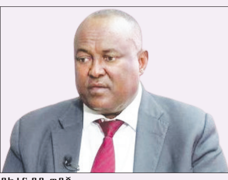
ደክተር ዳዲ ወዳጅ

በከተማው ውስጥ የሚከናወኑ የልማት ሥራዎችን በጥላን በመምራትና በመቆጣጠር የከተማውን እድገት እና ልማት ማሻሻል፤ እና በከተማው ውስጥ ከጊዜ ወደ ጊዜ እየተመዘገበ ያለውን እድገት እና ልማት በጥላን በመደገፍ ቀጣይነቱን የበለጠ ማረጋገጥን ዓላማው ያደረገው የአዲስ አበባ መዋቅራዊ ፕላን አዋጅ ቁጥር 52 /2017 የመሬት አጠቃቀም ፕላን አብይት ምድቦችን በ14 አብይ እና 72 ንዑሳን ምድቦች ከፍሎ ያስቀምጣቸዋል። እነዚህም፡- ቅይጥ መኖሪያ፣ ንግድ ሥራ፣ አስተዳደራዊ አገልግሎት፣ ማህበራዊ አገልግሎት፣ ማዘጋጃ ቤታዊ አገልግሎት፣ የመጓጓዣ አገልግሎት፣ የመሠረተ ልማት አገልግሎት፣ የመንገድ መረብ፣ የአካባቢ ጥበቃ፣ የከተማ ግብርና፣ ማምረቻና ማከማቻ፣ ልዩ ፕሮጀክቶች፣ ታሪካዊ ግንባታዎችና ስፍራዎች፣ እና ጥበቅ አካባቢዎች መሆናቸውን የአዲስ አበባ ከተማ አስተዳደር ፕላንና ልማት ኮሚሽን ኮሚሽነር ዳዲ ወዳጅ (ዶ/ር) ይገልጻሉ። እንደ ደክተር ዳዲ ገለጻ፣ ቅይጥ የመኖሪያ መሬት አጠቃቀም ምድብ ስንል፡- አነስተኛ ጥግግት ያለው ቅይጥ የመኖሪያ መሬት፣ መካከለኛ ጥግግት ያለው ቅይጥ የመኖሪያ መሬት፣ ከአካባቢ ጥበቃና ከአረንጓዴ የደን ክልል ቦታ ተነስተው ለሚሰፍሩ ነዋሪዎች የተከለለ መሬት አጠቃቀምን ያካትታል፤ ከወንዝ ዳርቻ ክልልና ከተለያዩ አነስተኛ የአረንጓዴ መኖሪያ ቦታዎች የሚነሱ ነዋሪዎች በወንዝ ዳርቻና መኖሪያ ፕሮጀክቶች መሰረት በልማቱ ይታቀፋሉ። ለሌላው የንግድ ሥራ መሬት አጠቃቀም ምድብ ሲሆን የንግድ ሥራ ቦታ እና የገበያ ቦታ ምድብን በውስጡ ያካተተ ነው የሚሉት ኮሚሽነሩ፤ ከአነስተኛ