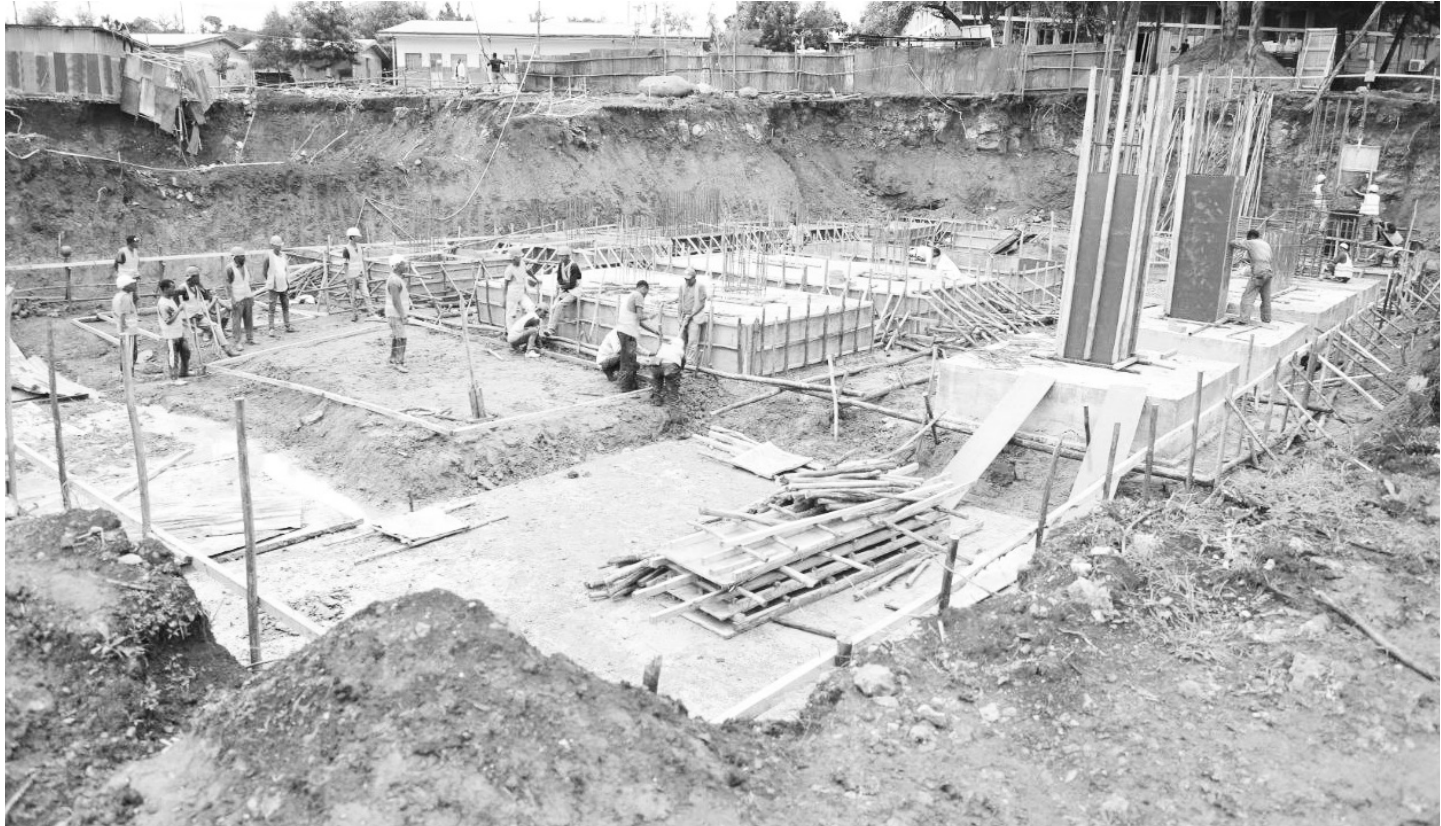
የማዕከሉ ግንባታ ባለፈው የካቲት የተጀመረ ሲሆን፣ በአስራ ሶስት ወራት ለማጠናቀቅ እየተሰራ ይገኛል።