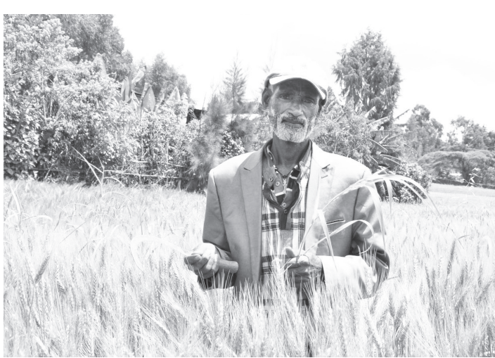
አርሶ አደር አበበ ሸዋንዳንው