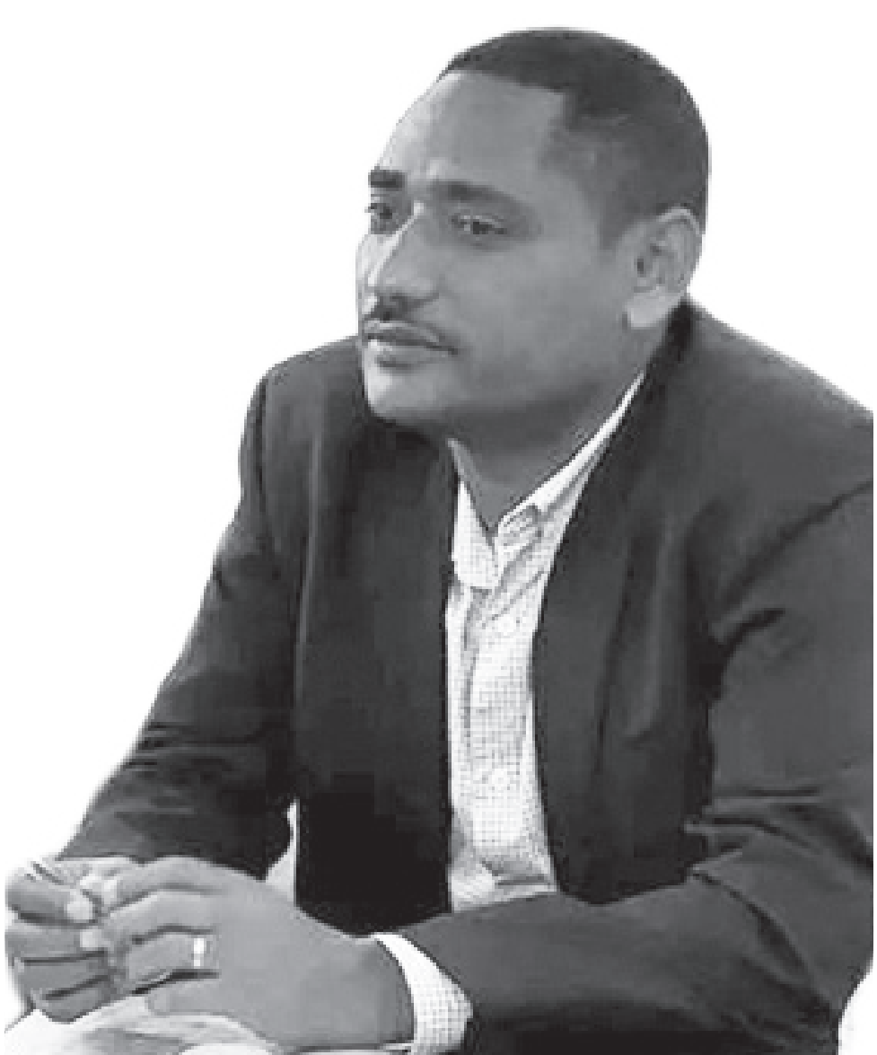
ዶ/ር ገበየሁ ሊካሳ

የተለመደ መልስ ለሕዝብ አንሰጥም የሚሉት ዋና ስራ አስፈጻሚ ዶ/ር ገበየሁ ሊካሳ፣ የኃይል መቆራረጡን በተመለከተ ከመነሻው ለማስረዳት የኢትዮጵያ የኤሌክትሪክ መሰረተ ልማት ደካማ ነበር። 1990ዎቹ ላይ 400 ሜጋ ዋት ኃይል ነው የነበረን። ስለዚህ መንግስት እስትራቴጂካል ለኃይል ማመንጫ ጣቢያዎች ቅድሚያ ሰጥቶ፣ ከፍተኛ ፋይናንስ መድቦ ብዙ ስራዎችን ሰርቷል። ከየትኛውም ሴክተር በበለጠ ኤሌክትሪክ ላይ ነው ሀብት የፈሰሰው። በዚህም አሁን ያለን የኃይል ማመንጫ አምስት ሺህ ሜጋ ዋት ደርሷል። ይህ ከሁለት አመት በኋላ አስር ሺህ ሜጋ ዋት ይደርሳል። ይህ ከአኛም ተርፎ ለጎረቤት ሀገራት የሚተርፍ ነው የሚሆነው። በዛው ልክ