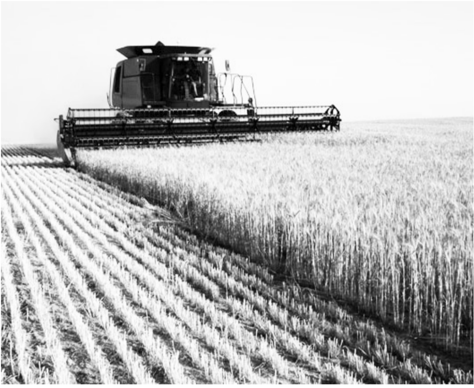
በሰፋት ስፋት ማህበራዊ የኩታ ገጠም እርሻን ከሕንድ ሚሊዮን ሄክታር ወደ ስድስት ነጥብ ሕንድ ሚሊዮን ማሳደግ ተችሏል

ዩኒቨርሲቲ ግብርና ኮሌጅ መምህር ናቸው። ፒኤችዲያቸውን በአግሪካል ፊልድ ኢኮኖሚ እያጠናቀቁ ይገኛሉ። በግብርናው ዘርፍ በገጠር ቴክኖሎጂ ማስፋፊያ ላይም መርተዋል፤ ረዳት ፕሮግራም የኢትዮጵያ ግብርና የሚታወቀው የተጠባጠሰ እርሻ (ፍራግመንት) በሚለው ነው ይላሉ።