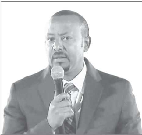
ጠቅላይ ሚኒስትር ዐቢይ አሕመድ

ይህንን ቀን እንድናይ ያደረገንን ፈጣሪ መላው የኢትዮጵያ ሕዝብ እንዲያመሰግን ከአደራ ጭምር አሳስባለሁ ብለዋል። በሌላ በኩል በቀጣዩ ሣምንት