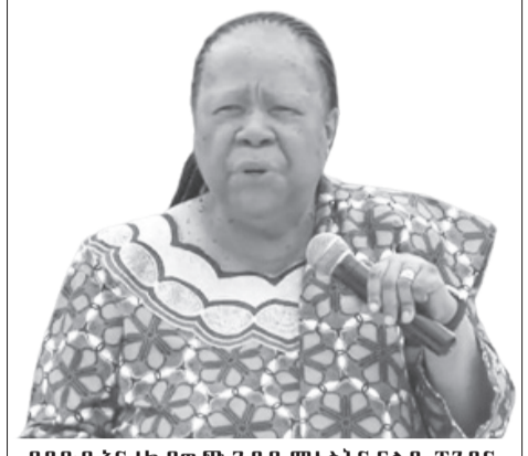
የደቡብ አፍሪካ የውጭ ጉዳይ ሚኒስትር ናሌዲ ፓንዶር

በክልሉ ላይ የተፈጠረው ችግር ከባድ ከመሆኑ አንጻር በክልሉ ትምህርት ቢሮ ብቻ ለመፍታት ያዳግታል ያሉት ዳይሬክተሩ፤ ሁሉም አካላት ለትግራይ ክልል እገዛ ሊያደርጉ ይገባል ብለዋል።