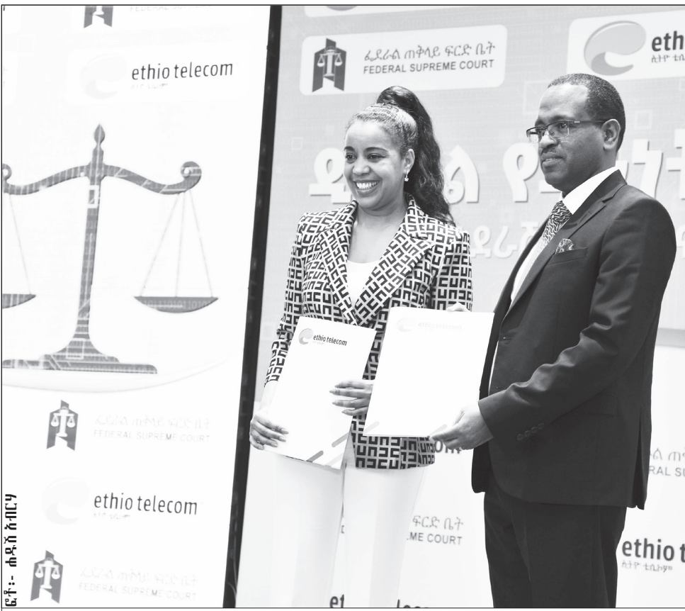
ፊት- ሐዲስ አበባ