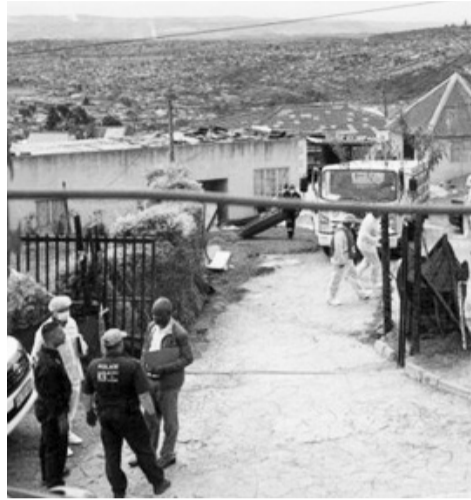
ውስጥ መገናኛ ብዙሃን ዘግበዋል።

ጥቃቱን የፈጸሙት ታጣቂዎች የፖሊስ አባላት መስለው ወደ ቤት ውስጥ መግባት እንደቻሉ የአገር