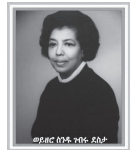
ወይዘሮ ስንዴ ገብሩ ደስታ

ወይዘሮ ስንዴ ከ1948 ዓ.ም አስከ 1952 ዓ.ም ድረስ የመጀመሪያዋ የሴት የሕግ መምሪያ ምክር ቤት አባልና የሕግ መወሰኛ ምክር ቤት ምክትል ሊቀ መንበር ሆነው አገልግለዋል። በዚህ ምክር ቤት አባል በነበሩበት ጊዜ ብቸኛዋ ሴት ከመሆናቸውም ባሻገር የሴቶች እኩልነት በማይከበርበት ጊዜ እና «የወንድ ዓለም» በገነባበት የታሪክ ምዕራፍ የሴቶችን ሰብዓዊ መብት ለማስከበርና እኩልነትን በሕግ ለማስተማምን ብዙ የታገሉ ሴት ነበሩ።