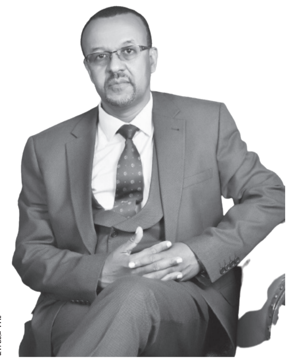
ዶ.ቲ. ወ.ወ. ገ.ገ.ሴ

«የውትድርና ቤት ለእኔ ለሕይወቴም በጣም ጥሩ ነው። ወትድርና ትልቅ ትምህርት ቤት ነው። ወታደራዊ ሳይንስም ትልቅ ዕውቀት ነው። ምንም እንኳን ፈቅጂና ተቀጥሬ ያልሄድኩ ቢሆንም፣ አሁን