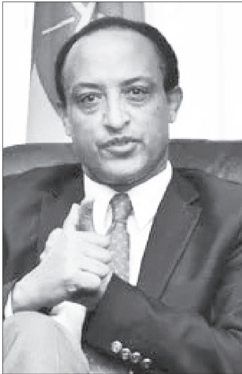
አምባሳደር መስላክ ዓለም