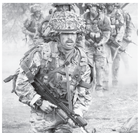
አያደረገ መሆኑን ገልጿል።

ሰንደይ ታይምስ በአውሮፓውያን 2021 የዩናይትድ ኪንግደም መከላከያ ማኒፊስቱር ግድያውን ለመሸፋፈን እየሞከረ ነው በሚል መዘገቡን ተከትሎ ማኒፊስቱር ከኬንያ ባለስልጣናት ጋር በምርመራ ላይ ትብብር