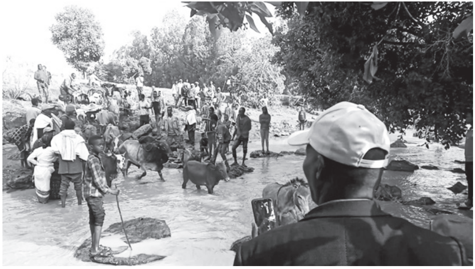
በሀዲያ ዞን ጎንቦራ ወረዳ ገርግ ቀበሌ ባስፈው ዓመት የዎገና ስርዓት በተካሄደበት ወቅት፤

አያበቃም። እጩ መሃራን እና ቤተሰቡ ከአካባቢው ማህበረሰብ ጋር ያለው መስተጋብርም ይጣራል። እጩ መሃራን እና ባለቤቱ ከአካባቢው ማህበረሰብ ጋር ያላቸው መስተጋብር፣ በማህበራዊ እና ባህላዊ ጉዳዮች ላይ ያላቸው ንቁ ተሳትፎ፣ ሀቅኝነታቸው፣ አስታራቂነታቸው፣ የተቸገረን የመርዳት ሁኔታቸው፣ ወዘተ ምን እንደሚመስል የአካባቢውን ማህበረሰብ በመጠየቅ ያጣራሉ። እነዚህን ነገሮች ከተረጋገጡ በኋላ አርቢው የዎገና ስርዓት ለማዘጋጀት ብቁ መሆኑ ሲረጋገጥ የዎገና ስርዓት እንዲያዘጋጅ ይሁንታ ይሰጠዋል።