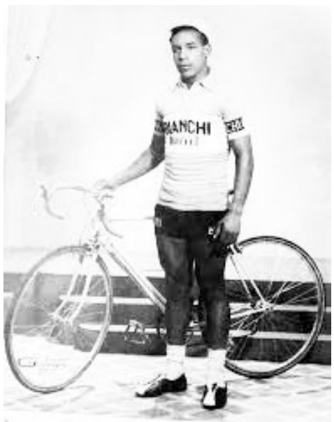
በቅርቡ ሕይወቱ ያሰፈው አንጋፋው ብስክሌት ገረመው ደንቦባ።

በጎዳና ላይ በተደረገ የዓለም የብስክሌት ግልቢያ ውድድር 24ኛ ደረጃን ይዘው ያጠናቀቁ ሲሆን ያስመዘገበው ደረጃ ከአፍሪካ እና ከእስያ ተጫዋቾች ቀዳሚ አድርጎታል። በጊዜው ኢትዮጵያ በብስክሌት በቡድን አራተኛ እንድትወጣም አስችሏል። 17ኛው የአሊምፒክ ጨዋታዎች በግሊያን ሮም እ.ኤ.አ በ1960