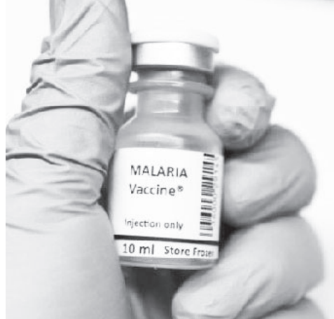
ነገር ግን በአፍሪካ ለሚገኙ አንዳንድ ባለስልጣን እና ሳይንቲስቶች ደርሷል።

ይህንንም ባለፈው ዓመት መጨረሻ እንደሚደረግ ሲጠበቅ የነበረ ሲሆን ውጤቱ እስካሁን ይፋ አልሆነም።