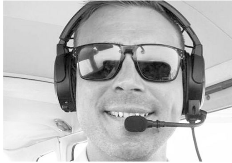
ፕሮቶቶይ አየር ማረፊያ ለማሳረፍ ተገደደ። ይህ የግል አውሮፕላን አራት ሰዎችን አሳፍሮ ነበር። ኬፕ በሚል ቅጽል የሚጠራው አባብ አንዱ ከነደፈ ገዳይ ሲሆን አንድ ሰው በዚህ አባብ ተነድፎ በአይወት ሊቆይ የሚችለው ለግማሽ ሰዓት ብቻ ነው።