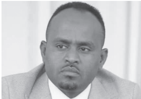
ሸ ት ሸንድሪስ ሸብዳ

አዲስ አበባ፡- በአማራ ክልል በተፈጠረው ሰላም ባለፉት ሰባት ወራት 344 ቢሊዮን ብር በላይ ካፒታል ያስመዘገቡ ባለሀብቶች ፍቃድ መውሰዳቸውን የክልሉ ኢንዱስትሪና ኢንቨስትመንት ቢሮ ገለጸ። በክልሉ የኢንዱስትሪ ምርቶችን ወደ ውጭ ሀገር በመላክ ከ96 ሚሊዮን ዶላር በላይ የውጭ ምንዛሪ ሲገኝ ከ804 ሚሊዮን ዶላር በላይ የውጭ ምንዛሪ ማዳን ተችሏል ብሏል። ኢንዱስትሪዎቹም 500 ሺህ ለሚደርሱ ዜጎች የሥራ ዕድል የመፍጠር አቅም አንዳላቸው ተጠቁሟል።