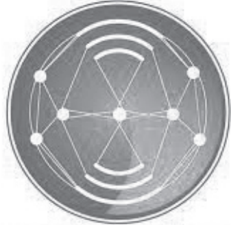
በኢ.ፌ.ዴ.ሪ የመንግሥት ኮሙኒኬሽን አገልግሎት FDRE Government Communication Service

በተለያዩ የጸጥታ መዋቅሮች የግዛት ውሳኔና የተግባር እንቅስቃሴ በጥናት ላይ ተመሥርቶ የሚከናወን ነው። ይህ አካሄድ የኢኮኖሚ አቅማችንን በማሰባሰብ የሠራዊታችንን የሥልጠና፣ የትጥቅ እና የኑሮ ሁኔታ ለማሻሻል ከፍተኛ ፋይዳ አለው። ይህንን በመረዳትም በሁሉም ክልሎች ላይ በመግባባትና በውይይት እየተከናወነ ይገኛል። ሆኖም በአማራ ክልል በሚገኙ የተወሰኑ የልዩ ኃይል ክፍሎች ውስጥ፤ በአንድ በኩል የመልሶ ማደራጀት ሥራውንና