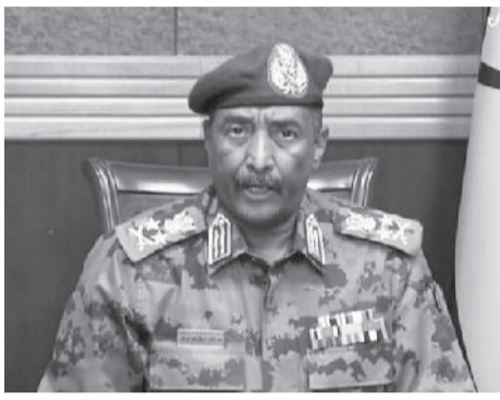
ጀነራል ስብደል ፈታህ አል-ቡርሃን

ጀነራል አል-ቡርሃን የሚሊሻ አባላቱ በሁለት ዓመት ውስጥ ወደ አገሪቱ ጦር መግባት አለባቸው ሲሉ ሄምቲ በሚለው ቅጽል ስማቸው የሚታወቁት ጀነራል ሞሐመድ