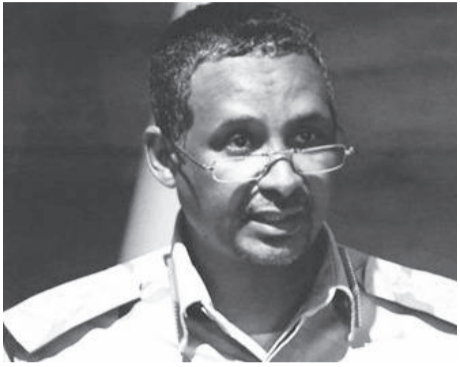
ጀነራል መስመድ ሐምዳን ዳጋቡ

ጦር በበኩሉ የጦር ጀዮችን በመጠቀም የፈጥኖ ደራሽ ልዩ ኃይሎች ጦር ሰፈርን መምታቱን ገልጿል። ቁልፍ የሚባሉ ቦታዎችን ተቆጣጥሮ እንደሚቆይ ብሏል።