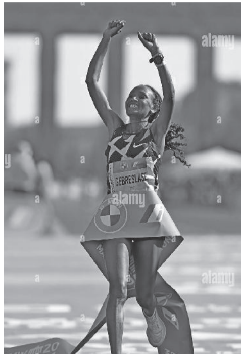
አትሌት ጎይተቶም ገብረሥላሴ ሲላሳ ዲላር በዛሬው የቦስተን ማራቶን ሰድስት ሚሊዮን ዲላር የሚጠበቁ ኢትዮጵያውያን

በማራቶን የኢትዮጵያ የሴቶች ክብረወሰን በመስበር 2:14:58 ሰዓት ያስመዘገበችው ሌላኛዋ ኢትዮጵያዊት አትሌት አማሌ በሪሶ በዛሬው የቦስተን ማራቶን ትኩረት የተሰጣት ሆናለች። ይህች የሠላሳ ስድስት ዓመት አትሌት እኤአ በ2016 ይህን የቦስተን ማራቶን ማሸነፍ የቻለች ሲሆን፣ እኤአ በ2012 እንዲሁም በ2016 የቼካን ማራቶንን በድል ፈጽማለች። በተጨማሪም እኤአ በ2009 እና 2010 የፓሪስ ማራቶንን አከታትላ