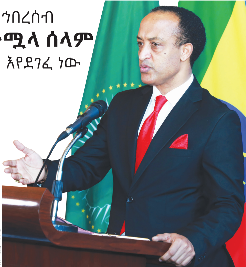
አምባሳደር መለስ አለም