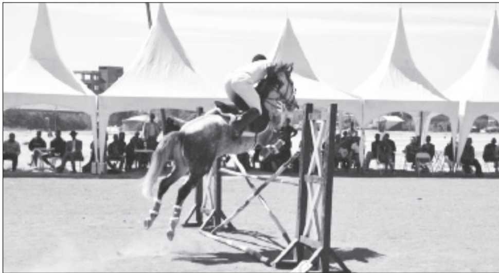
የፈረስ ስፖርትን በክልሎች ለማስፋፋት አሰጣጥን ወደ ፌዴሬሽን የማሳደግ ሥራ ተጀምሯል።

ይህን ስፖርት ይበልጥ ለማሳደግ የአደረጃጀት ለውጥ በማስፈለጉ ከአሰጣጥ ወደ ፌዴሬሽን ደረጃ ለማሳደግ ሥራዎች መጀመራቸውን ታውቋል። የባህልና ስፖርት