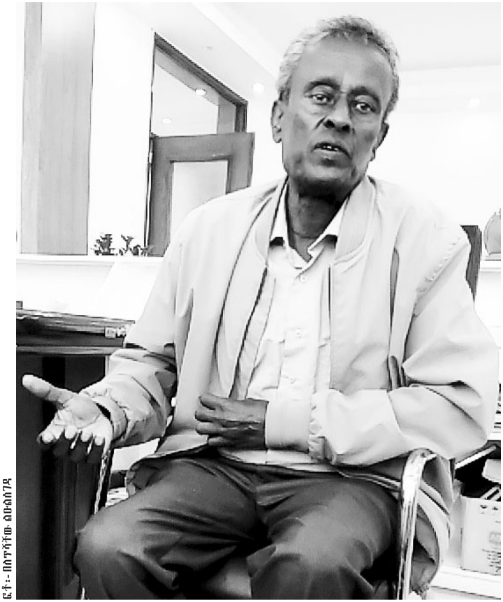
መምህርና ጋዜጠኛ በለጠ ከተማ

በተለይ ከሦስተኛ ክፍል ወደ ስድስተኛ ክፍል በአንድ ጊዜ የተዘዋዋሩበትን ሁኔታ ዛሬም እንደሚታይበት ይወሳሉ። ከታች ክፍል ጀምሮ የተማሪያቸውና ገብነታቸውን የሚያውቀው አንድ መምህር የአምስተኛ ተማሪዎችን ሲያስተምሩ አንድ ጥያቄ ይጠይቋቸዋል። ሆኖም ጥያቄውን ሁሉም አልመለሱም። «ቆየኝ ይህን ጥያቄ የሚመልስ የሦስተኛ ክፍል ተማሪ አመጣላችኋለሁ» አሉና በለጠን ወደ አምስተኛ ክፍል አስጠራቸው። የመምህሩ ጥያቄ ከአፋቸው እንደወጣ ትንታጉ ተማሪ ጥያቄውን በትክክል መለሱ። ይህን የሚከታተለው ርዕሰ መምህር በአጠቃላይም መምህራኑና የትምህርት አመራሩ ለምን ስድስተኛ ክፍል አስገብተን እናየውም ተባብረው። በአንድ ጊዜም ደብል መጥተው ስድስተኛ ክፍል ገቡ። ስድስተኛ ክፍል ሚኒስትሪ ፈተና የሚወሰድበት መሆኑ