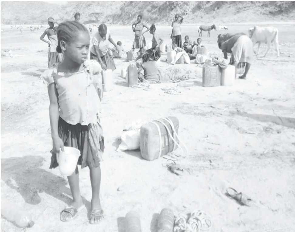
የስጠቅም የነበረው ወይጦ ወንዝ በድርቁ ምክንያት መሰረቱ በሙሉ በመደረቁ ክንስሳትና ሰዎች ለችግር መጋለጣቸውን አስረድተዋል።

የደቡብ አም ስም እርሶአደሮችን እንዲሁም አጎራባች ዞንና በኬንያ ድንበር የሚገኙ አርብቶ አደሮችን ጭምር