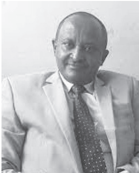
ሐቶ ደበበ ዘውዴ