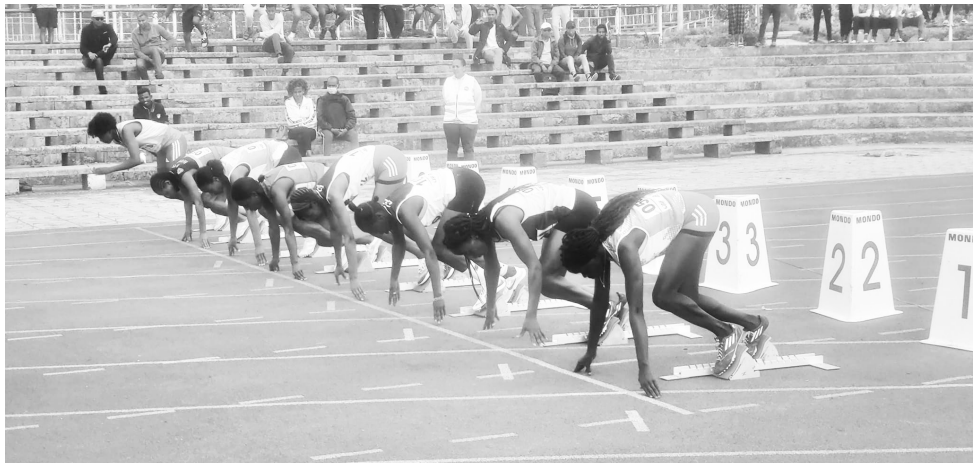
በአጭር ርቀትና የሜዳ ተግባራት ውድድሮች የሚሰጥበት የቴክኒክ ችግር ስለሆነም ስልተቀረፊም፡

በኢትዮጵያ ወጣቶች ስፖርት አካዳሚ ለአምስት ቀናት የሚካሄደው የኢትዮጵያ ክለሰች አጭር፣ መካከለኛ፣ 3ሺ ሜትር መሰናክል፣ እርምጃ እና የሜዳ ተግባራት ቻምፒዮና ነገ ይጠናቀቃል። ይህ ዓመታዊ ውድድር የሚካሄደው ኢትዮጵያ እምብዛም በማትታውቅበት የኢትዮጵያ ውድድሮች የተሻለ መነቃቃት እንዲፈጠር ቢሆንም አሁንም ተስፋ የሚሰጥ ውጤት አይታይም።