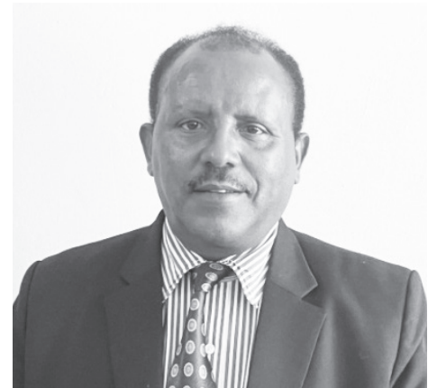
ስነ ጋሻው ተፈራ፤

በዚህም ከጥር 1 ቀን 2015 ዓ.ም ጀምሮ መገናኛ በሚገኘው የቤት ክፍለ ከተማ አስተዳደር ቅጥር ግቢ ውስጥ በኮርፖሬሽኑ የአንድ ማዕከል አገልግሎት መስጫ የጋራ መኖሪያ ቤት የቤት ባለ ዕድለኞች ውል በመዋወል ላይ እንደሚገኙ ጠቁመው፤ የ20/80 እና የ40/60 የጋራ መኖሪያ ቤቶች ዕድለኞች እስከ መጋቢት 7/2015 ዓ.ም ድረስ ወደ አንድ ማዕከል ቀርቦውና ተመዝግበው ቅፅ 09 የወሰዱት 25 ሺ 412 ናቸው። ከዚህ ውስጥ ቅፅ 09 ወሰደው ከቀበሌ አስፈላጊውን ሂደት አጠናቀው ሪፖርት ካደረጉ በኋላ ቅፅ 03 ወሰደው ከባንክ ጋር