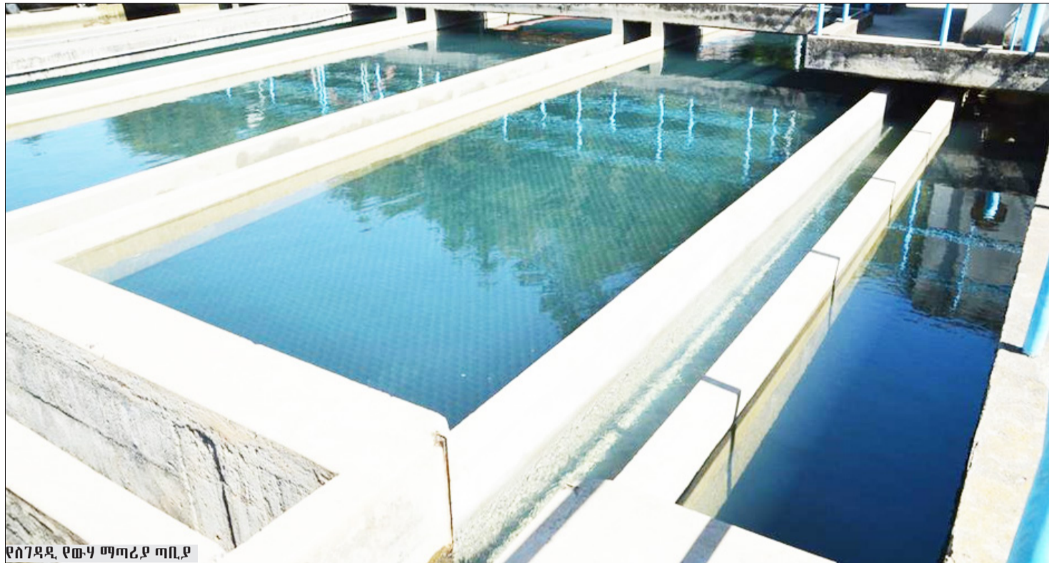
የስገዳዲ የውሃ ማጣሪያ ጣቢያ

ሰኞ 82ኛ ዓመት ቁጥር 177 የካቲት 27 ቀን 2015 ዓ.ም ሠኞ 10.00 ብዕራችን ለኢትዮጵያ ህዳሴ ይተጋል!