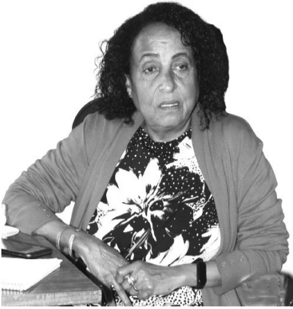
ጋዜጠኛ አባይነሽ ብሩ