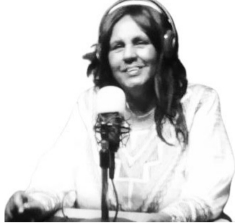
ጋዜጠኛ የምወደሽ በቀስ