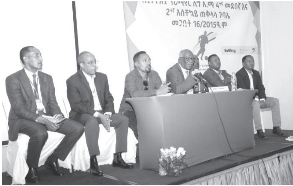
የኢትዮጵያ ፕሪምየር ሊግ አክሲዮን ማህበር አዳዲስ የዳይሬክተሮች ቦርድ አባላትን መርጧል።

ለረጅም ዓመታት በስፖርት አመራርነት የቆዩት አንጋፋው ባለሙያ፣ ሊግ ካምፓኒው ከተቋቋመ ሰዓት ዓመታትን ብቻ ያስቆጠረ ይሁን እንጂ በርካታ ነገሮች የተሰሩ መሆኑን ገልጾታል። በቅድሚያ የተደረገው በአፍሪካ ትልቅ ከሚባል ተቋም ጋር አብሮ ለመስራት ከስምምነት መድረስ ስኬት ነው። ቀጣዩ ደግሞ ይህንን ተቋም ኢትዮጵያ ውስጥ እንዲቆይ ማድረግ፣ ከፍተኛውን እንዲጨምር ማድረግ፣ ሜዳዎች ብቁ የሚሆኑ ከሆነ ደግሞ እንደሌሎች ሀገራት ማስታወቂያዎችን በዘመናዊ መንገድ ማስተላለፍ እንዲሁም ጨዋታዎችን ስፖንሰር የሚያደርጉ ባለቤቶችን በመጋበዝ