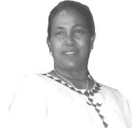
ጋዜጠኛ ዘበዳሪ ጌታችው