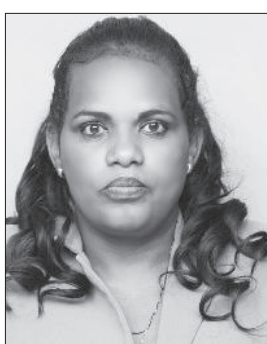
የተከበሩ ወይዘሮ አዲሷ አሰፋ