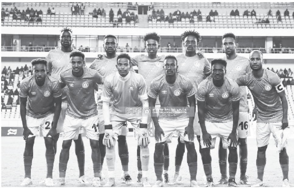
ዋሊያዎች ከ17 በስተቀ በአቋም መስኪያ ጨዋታ ሩዋንዳን ይገጥማሉ።

የአፍሪካ እግር ኳስ ኮንፌዴሬሽን (ካፍ) የስታዲየሞች ዝቅተኛ መስፈርትን ባለማሟላቷ የትኛውንም አሀገር እንዲሁም ዓለም አቀፍ ውድድሮች በሃገሯ እንዳታስተናግድ የታገደችው ኢትዮጵያ