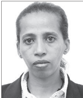
የተከበሩ ወይዘሮ ሙሉ ደርጋ